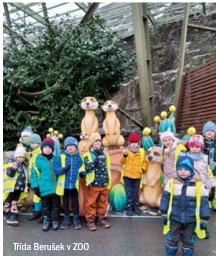
Třída Berušek v ZOO

Vidět lední medvědy nebo tučňáky na vlastní oči jsme se rozhodli se třídou Berušek v rámci našeho třídního zimního