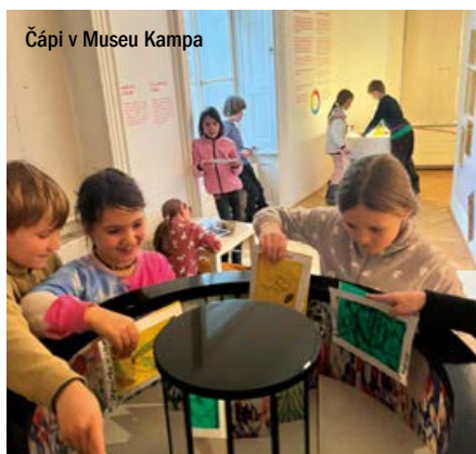
Čápi v Museu Kampa