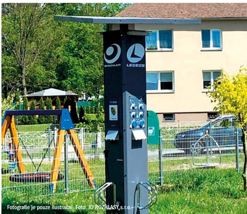
Fotografie je pouze ilustrační.

LUKÁŠ HEJDUK ZASTUPITEL ZA TOP 09 A NEZÁVISLÉ