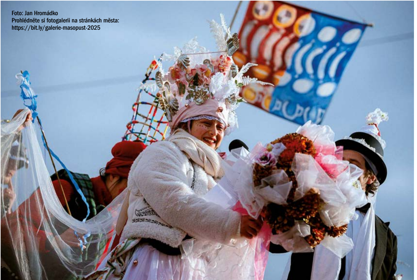
Prohlédněte si fotogalerii na stránkách města: https://bit.ly/galerie-masopust-2025

Z oken domů vlály masopustní vlajky, v průvodu vyhrávaly kapely (dokonce jedna šla na chůdách), tančilo se u kostela a díky masopustnímu vysílání městského rozhlasu mohly tančit celé Roztoky waltz. A tančilo se i večer v šapitó, které pro tuto příležitost vyrostlo na louce u přívozu.