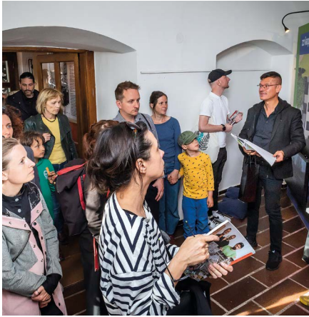
Z výstavy Město pro každého, foto: David Háva

Rok 2025 se pomalu chýlí ke konci. Na jeho závěr jsme nachystali řadu novinek, mezi něž patří dvě nové výstavy, které si užijete s celou rodinou. Nechte za sebou shon běžného dne a zastavte se u nás. Dýchne na vás tady ta pravá předvánoční atmosféra. Protože být spolu (nejen) o Vánocích je to nejlepší.