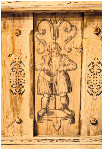
Detail renesančního stropu v 1. patře roztockého zámku, snad s vyobrazením Davida Boryně

Protože však byl zřejmě i značně vychytralý, deset let nato se stal hejtmánem Slánského kraje a značně zbohatl. Těžko říci, co bylo dříve, zda rytířovo zbohatnutí, nebo úřad hejtmána... Pro Roztoky ovšem nastalo šťastnější období, neb skončilo časté střídání majitelů, které neblaze působilo na ekonomickou stabilitu majetku. K prosperitě jeho podnikání jistě přispělo i to, že založil pivovar s vlastní chmelnicí. Protože peníze dělají peníze, zisky z podnikání zhodnocoval půjčkami na vysoký úrok a posiloval tak i svůj společenský vliv coby věřitel řady vlivných osob tehdejší doby. Začal také s přestavbou gotické tvrze na pohodlné rezidenční sídlo, když se sem z Míkovic trvale přestěhoval. Hlavní fáze renesanční přestavby však asi spadá