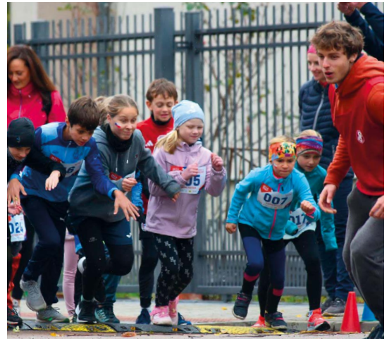
Start dětského závodu SBR 2025 – předběžec měl co dělat, aby ho děti nedostihly