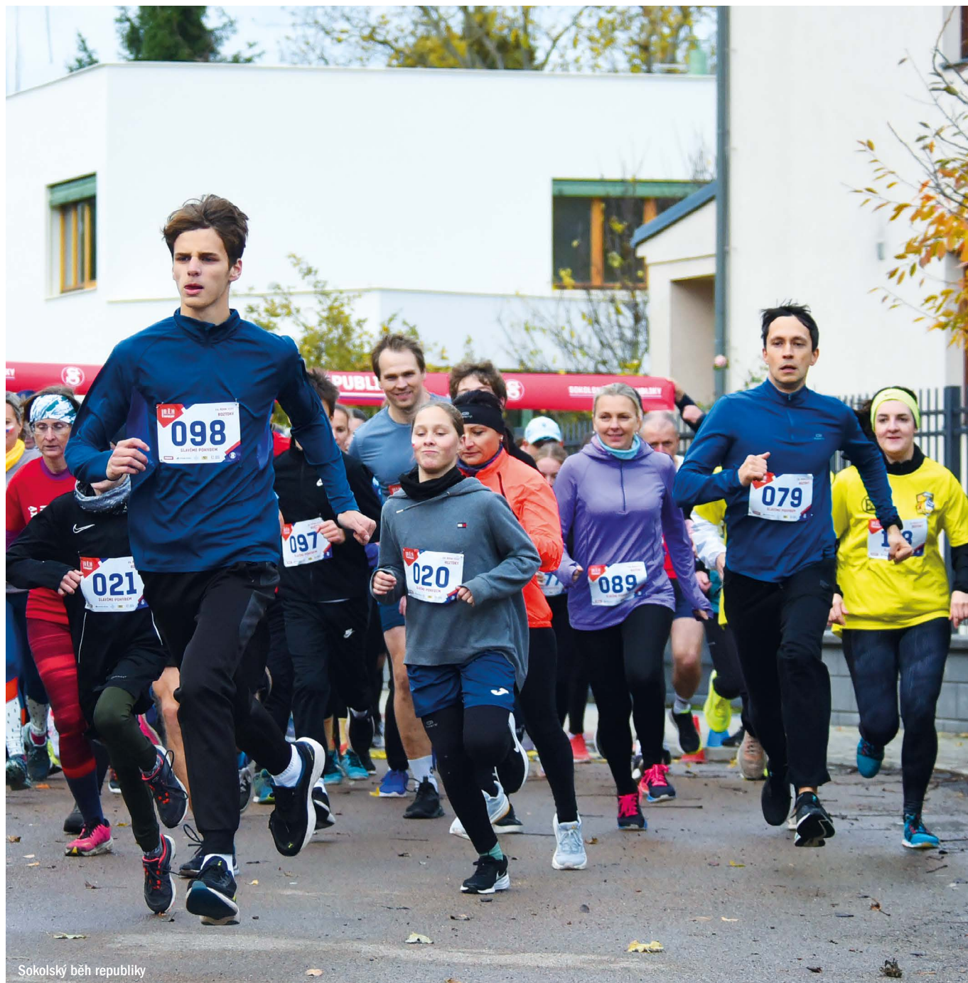
Sokolský běh republiky