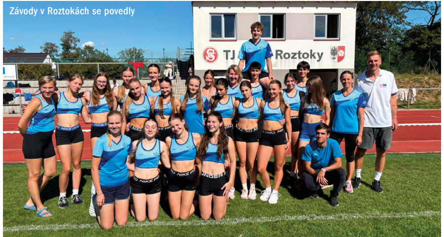
Závody v Roztokách se povedly

stev žactva. I zde se roztockým barvám dařilo – z této soutěže jsme si odvezli mnoho cenných kovů a řadu osobních rekordů. Těší nás, že naše mládež potvrzuje výbornou tréninkovou morálku i týmového ducha.