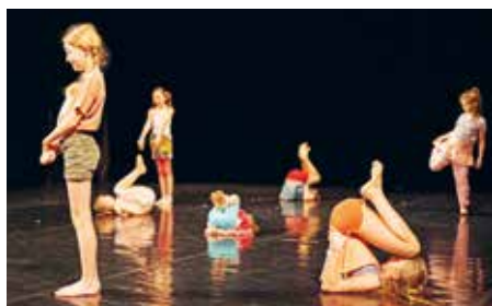
Děti z taneční přehlídky