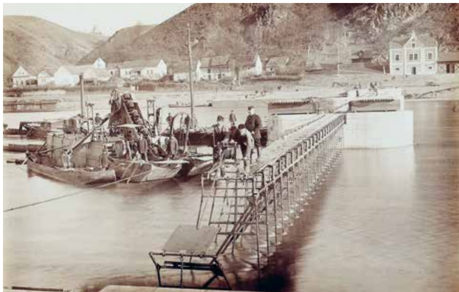
Stavba vodního díla Klecany-Roztoky, 1897–1898

Na letní sezonu připravuje Středočeské muzeum dvě výstavy věnované řece Vltavě.