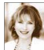
Vladimíra Drdová předsedkyně SPCCH