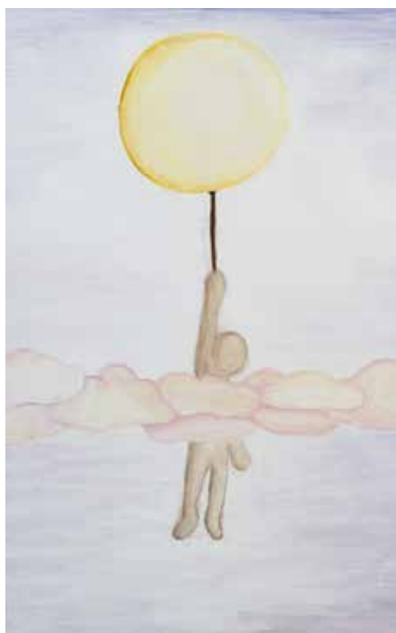
Vznášení, akryl, Jasmina Farghali