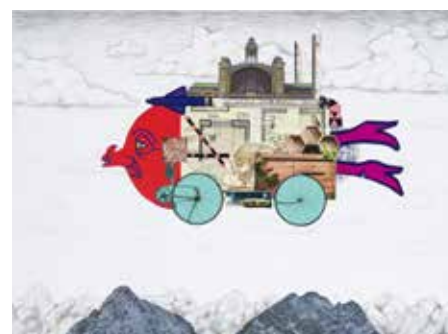
Osobní dopravní letoun, koláž, Sára Farfánová