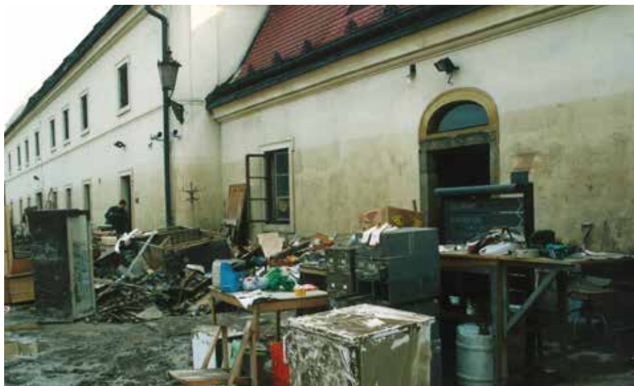
Zkáza v muzeu, poté co opadla voda