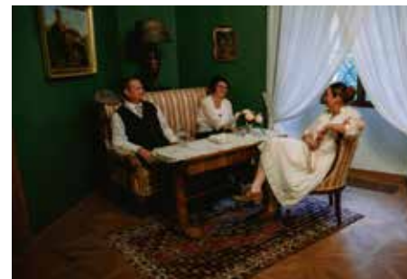
Kostýmní prohlídky zámecké expozice Život v letovisku