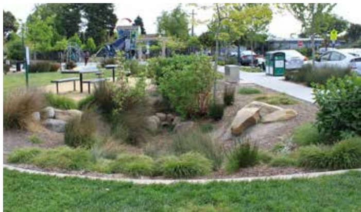
Jak může vypadat bioretenční nádrž? Za sucha zajímavý prvek, po dešti dočasné jezírko. Doyle-Hollis Park v Emeryville, CA.