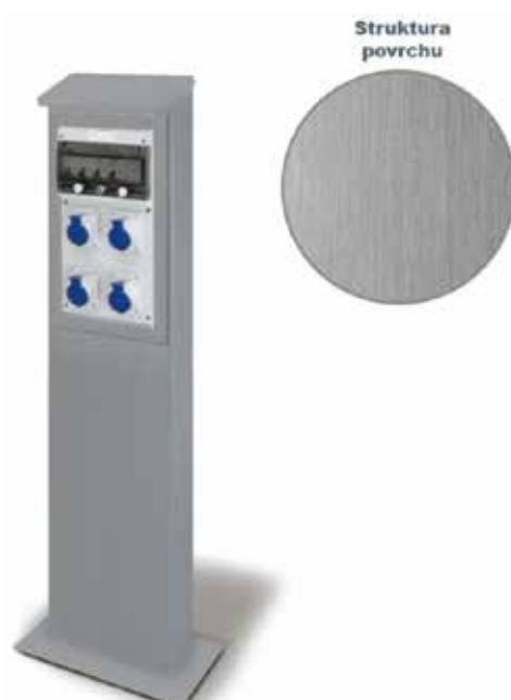
ODRAZ měsíčník Rostok a Žalova