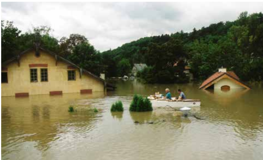
V noci na 14. srpna se protrhla protipovodňová hráz

Asi ve 22.30 hod přetekla hráz centrální pražské čistírny a Vltava se začala měnit ve stoku.