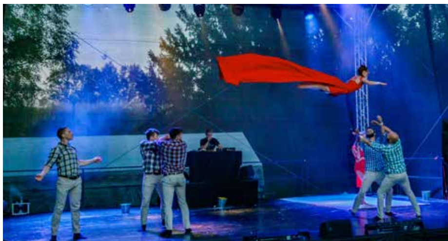
Akrobatická taneční show Losers Cirque Company