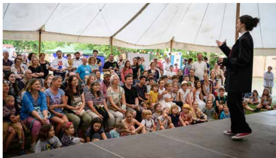
Zahrádková slavnost na Levém Hradci

Červen byl intenzivní, náročný, pestrý a taky šťavnatý. Na světlo jsme vynesli vytvořená a secvičená díla, která by jinak zůstala v skrytu našich ateliérů, a oslavili jsme školní rok slavností na Levém Hradci. Teď už ale roztáčíme v Roztoči přípravy na ten školní rok příští. Co chystáme nového? Kam se můžete přihlásit? Jak bylo a jak bude?