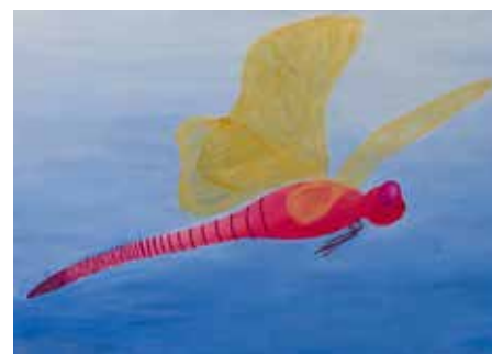
Vážka, akryl, Barbora Šolínová