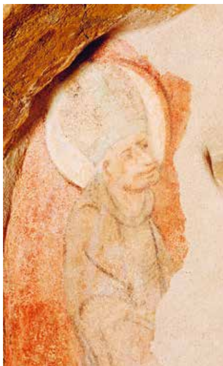
Nástěnná malba z konce 14. století v sedile presbytáře kostela sv. Klimenta na Levém Hradci, patrně zobrazující sv. Vojtěcha, objevená Zl. Dobošovou v roce 1997.

V minulém čísle připomněl Jiří Klapka v méně známých souvislostech osobnost sv. Vojtěcha Slavníkovce, který byl před 1040 lety zvolen na levohradeckém hradišti pražským biskupem. Protože, jak výstižně autor uvádí, tento Slavníkovec „patřil k nejvzdělanějším a nejtalentovanějším osobnostem své doby“, hodí se ještě trochu připomenout okolnosti této jeho volby, neboť opakování je matkou moudrosti.