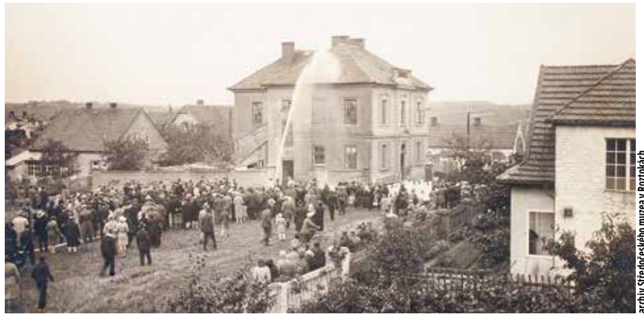
Cvičení jednotky dobrovolných hasičů na nádvoří roztockého velkostatku, poč. 20. století