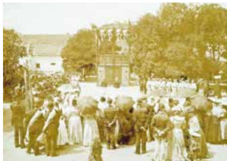
archiv Středoevropského muzea v Roztokách

Cvičení dobrovolných hasičů u příležitosti oslav 50. výročí existence sboru na dnešním Školním náměstí u chudobince, 1931