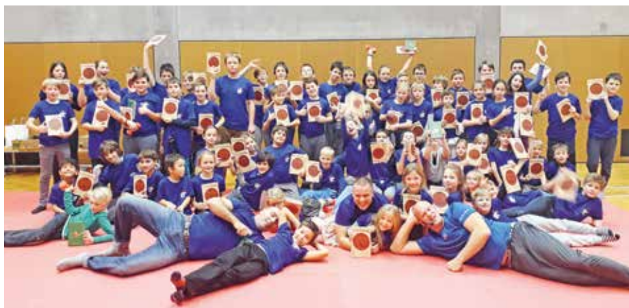
Kniha „47 Róninů“ udělala dětem velkou radost. Umožňuje jim poznat japonské legendy, navíc formou komiksu, který osloví malé i větší děti.

souvislosti fyzického pohybu a intelektuálního rozvoje. Jenže bohužel nad těmito studii jen pokývneme souhlasně hlavou, případně „olajkujeme“ na sociální síti a ... nic se nestane. A to chci změnit, to byl a je můj cíl zde v Roztokách. Jinými slovy – pokud se člověk naučí mít fyzický pohyb jako nedílnou součást svého života, podobně jako považuje základní hygienu, pak se může těšit na plnohodnotný život, radost z poznávání a hlavně z mnoha tzv. „AHA momentů“ i ve zralejším věku. Hovořím z vlastní zkušenosti. I to je důvod, proč se tak nadšeně pouštím stále do nových projektů.