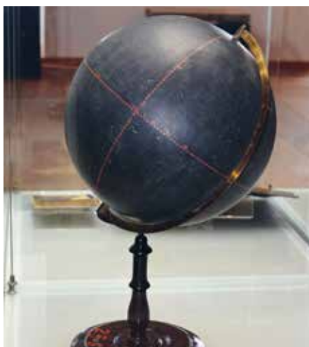
Učební pomůcka, indukční glóbus s povrchem z černé břidlice, který umožnil malování křídou (kol. 1870, soukr. sbírka)

Unikátní prezentace téměř 70 glóbů jediného výrobce – roztocké rodinné firmy Jan Felkl a syn – pokračuje a co víc, je stále doplňována novými exponáty. Nejen média se zajímají o výstavu, která je často přirovnávána k vídeňské expozici (Das Globenmuseum) Rakouské národní knihovny (ta v současné době prezentuje kolem 250 „zeměkoulí“ různých výrobců, za prvních 20 let existence toto muzeum shromáždilo 70 glóbů), ale výjimečný soubor nešel pozornosti místních sběratelů. A tak nám téměř každý týden přibude do vitríny jeden glóbus. Nejpočetnější jsou samozřejmě glóby zemské, ale byl nám zapůjčen i glóbus indukční s černým břidlicovým povrchem bez glóbové mapy, na kterém se děti v obecných školách učily zakreslit nejen Rakousko-Uhersko, ale i africké kolonie.