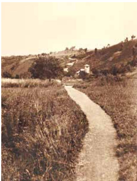
Kyzlíkova stezka z Tichého údolí k Suchdolu

Nejde ale jen o tyto „technikality“. Z krajiny mizí to, co jsme na ní znali a měli rádi, její málo zdravý stav u mnoha lidí vede