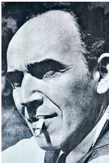
Filmový režisér Martin (Mac) Frič