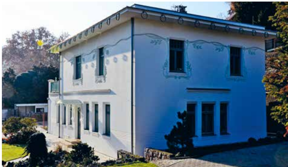
Dům čp. 16 v Tichém údolí

Nedávno nás s manželkou při procházce Tichým údolím zaujal krásný dům, vyhlížející jako novostavba, ale se secesní tváří počátku 20. století. Nedokázal jsem si srovnat v hlavě, kde se tam (nedaleko bývalých vinných sklepů L. Šlančara) vzal, když bych přísahal, že nic podobného tam dříve nestálo.