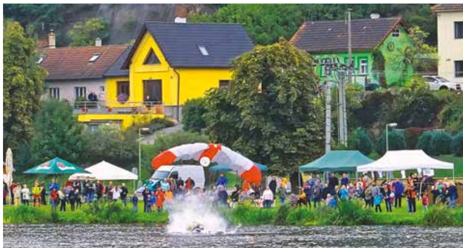
Seskok parašutistů do Vltavy je už tradiční atrakcí slavnosti