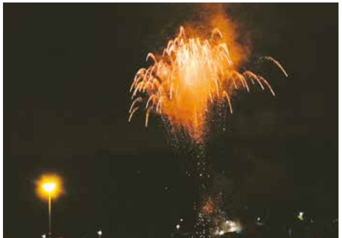
Program vyvrcholil nočním ohňostrojem