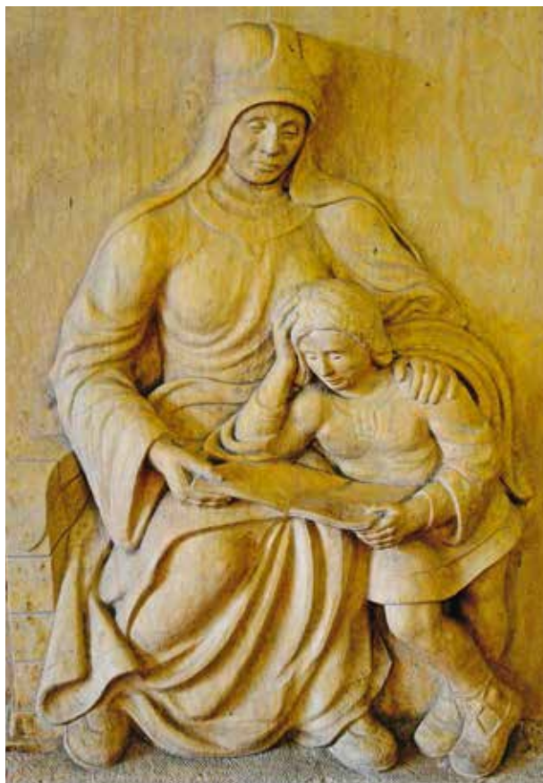
Relief „Sv. Ludmila vyučuje vnuka sv. Václava“ ve foyeru mělnické radnice.

Ikonografií sv. Ludmily se týkaly i další dva příspěvky; Ludmily Juzové z Pražské eparchie Pravoslavné církve v českých ze-