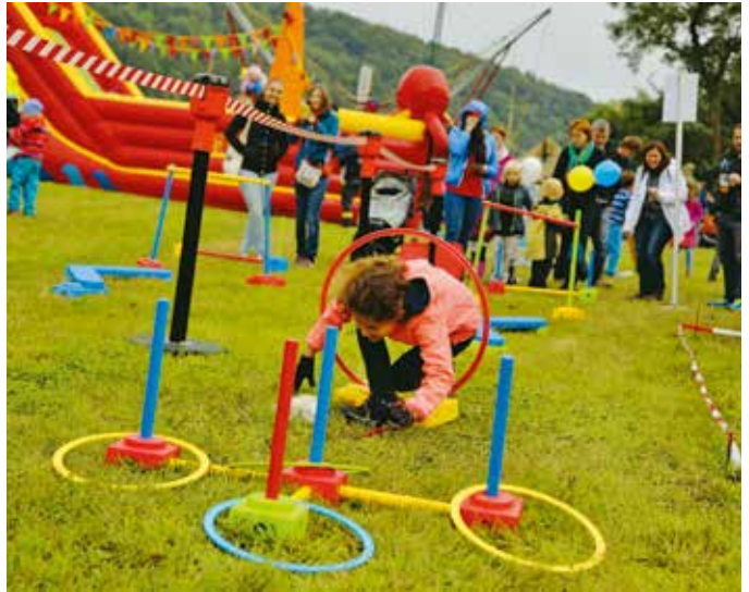
Program pro děti zdařile oživilo Letiště Praha