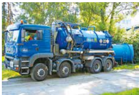
Aplikace bakteriálního preparátu spol. DEKONTA