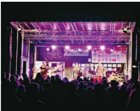
I na druhém břehu se odehrával bohatý program