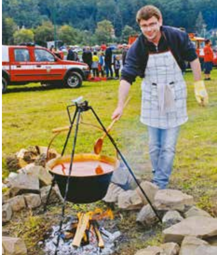
Pan starosta opět uvařil výtečnou gulášovou polévku. Jen se po ní zaprášilo

Atmosféru tohoto setkání si připomeneme fotografiemi Jana Žirovnického a Tomáše Kratochvíla.