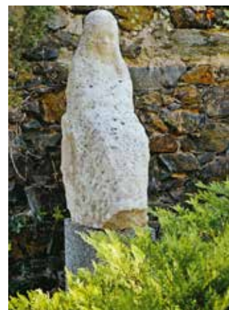
Hrob Jaroslava Zaorálka na Levém Hradci

naivně slavnostní, více smyslové než duchovní.“