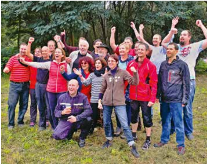
Bouřlivá radost vítězného týmu