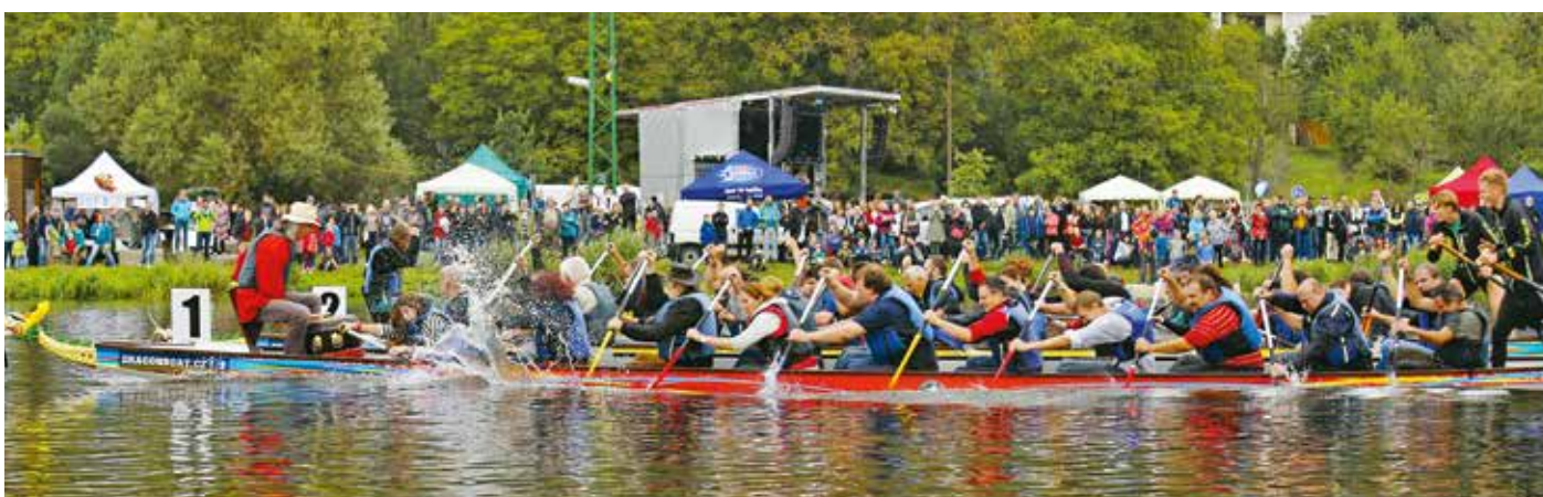
Novinkou letošního ročníku byly závody dračích lodí