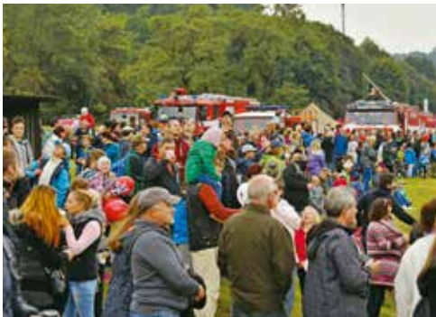
Akce opět přilákala početné publikum