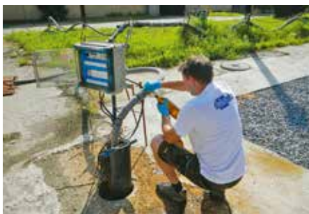
Odběr vzorků podzemní vody z čerpaných vrtů

První průzkumy znečištění proběhly již v roce 1997, následovaly první dílčí sanace zaměřené ale pouze na menší lokální ohniska. Komplexní sanace znečištění v celém areálu byla realizována až v posledních letech, konkrétně od června 2013 do května 2017. Sanaci prováděla odborná firma DEKONTA, a. s. Náklady na sanaci byly v plné výši hrazeny Ministerstvem financí ČR, ze speciálního fondu na staré ekologické zátěže vzniklé před privatizací. Kontrolu realizovaných prací prováděla nezávislá společnost SGS Czech Republic, s.r.o. Pravidelně byly pořádány kontrolní dny, na kterých byly probíhající práce prezentovány