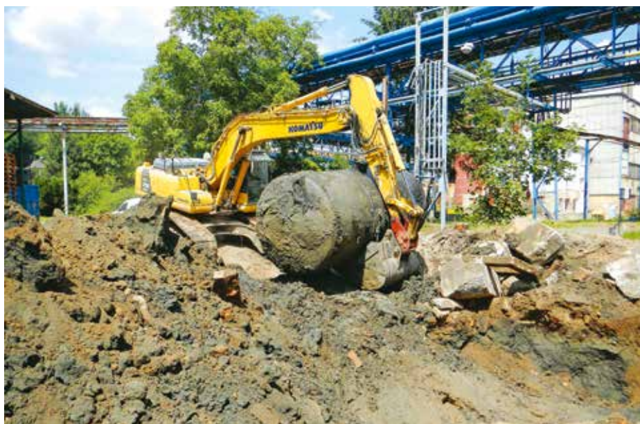
Vyjmutí podzemních nádrží na butylacetát

Na konci května 2017 byla dokončena sanace staré ekologické zátěže v areálu VUAB Pharma, a. s., (dodnes hovorově označovaném jako „Penicilinka“). Od roku 1938 probíhala v areálu nejprve výroba barev a laků, po 2. světové válce byl výrobní program změněn a zaměřil se výhradně na výrobu léčiv. Znečištění zemín a podzemních vod v tomto areálu vzniklo v průběhu několika desítek let výroby vlivem úniků a úkapů některých látek během skladování v podzemních i nadzemních nádržích a manipulací s nimi. Jednalo se zejména o úniky látky butylacetát, která se používala jako organické rozpouštědlo při výrobě penicilinu. Další znečištění představovaly ropné látky jako nafta a mazut (z provozu původní mazutové kotelny). Kontaminace se z areálu šířila především v generálním směru proudění podzemních vod k potenciálně ohroženým tzv. roztockým studnám a k Vltavě.