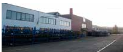
Koever CZ - Libčice nad Vltavou – Česká republika s tradicí od roku 2006