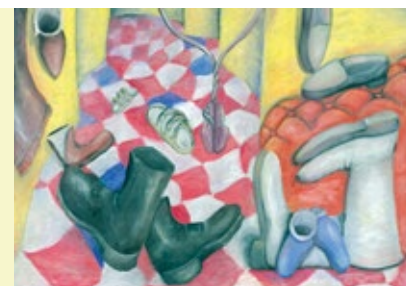
Eliška Panenková, 14 let Šatna sedmi trpaslíků tempera na papíře