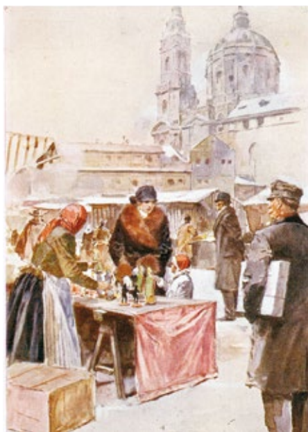
Pohlednice s mikulášským trhem na Malé Straně, 20. léta 20. století, ze sbírek Střeďočeského muzea

Svátek sv. Lucie (13. prosince), jejíž jméno je odvozeno od latinského slova lux – světlo, má velmi staré kořeny. Před změnou kalendářních propočtů na sklonku 16. století totiž vycházel tento svátek do doby slunovratu, tedy do doby, kdy se opět prodlužuje den a vrací se světlo. (Do té doby používala Evropa juliánský kalendář, zavedený již císařem Gaiem Juliem Caesarem, ve kterém se však v průběhu staletí nashromáždily časové chyby, takže se od reálné astronomické skutečnosti odchyloval a bylo nutné jej upravit. Změnu vyhlásil papež Řehoř XIII. v roce 1582, neboť číselně vyjádřené datum se rozcházel se skutečnými body oběhu Slunce, se slunovraty, o 10 dní. Úprava spočívala ve vynechání deseti dní v kalendáři tak, že po