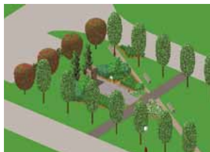
Vizualizace památníku na Školním náměstí

ven příčný chodník, vydlážděno prostranství před památníkem a bude i přiznána a vytvořena prošlapaná diagonální pěšina. Z tují zůstanou jen dvě, které budou symbolizovat svíce. Spousta další zeleně však bude v okolí památníku nově vysazena (hlohy, živý plot z hlohyní oddělující nedaleké parkoviště, šerříky a další). Budou zde také nově umístěny lavičky a informační cedule. Jak bude tento prostor vypadat, se můžete podívat na vizualizaci. Věřím, že bude okolí památníku důstojné, že se vám zde bude líbit a že příští rok dojde i na opravu samotného pomníku.