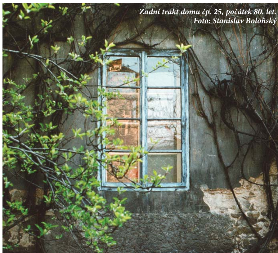
Zadní trakt domu čp. 25, počátek 80. let.