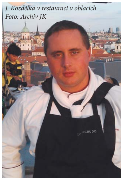
J. Kozdělka v restauraci v oblacích

Někomu jo, někomu ne. Určitě se to už zlepšilo, pár let zpátky bylo to stolování horší, v dnešní