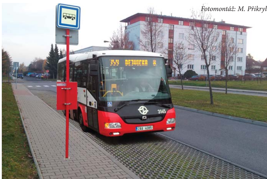
Fotomontáž: M. Příkryl

Dopravní obslužnost Solník bude skutečně řešena prodloužením linky č. 359 z Únětic. Tato linka v současnosti jezdí z Dejvické přes Suchdol a končí právě v Úněticích. Její trasa by měla být z Únětic prodloužena do Roztok k nádraží s tím, že bude zajíždět do Solníků. Ze své trasy po Lidické ulici se odkloní ulicí Obránců míru až k dětskému hřišti, kde zatočí doleva na Masarykovu ulici. Kousek za tímto hřištěm bude nová zastávka Solníky. Autobusy se