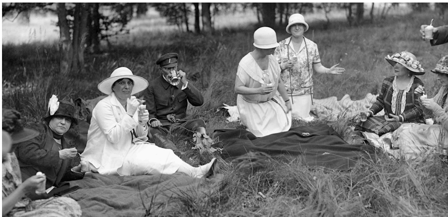
Prezident Masaryk s dcerou Alicí ve společnosti manželek účastníků konference Malé dohody v zámeckém parku (např. Hany Benešové), 14. 7. 1924

Manželky prezidentů byly takřka vždy nedílnou součástí společenského dění a nezřídka stály na jeho pomyslném vrcholu. Často byly nezaměnitelným způsobem národem vnímány (zejména