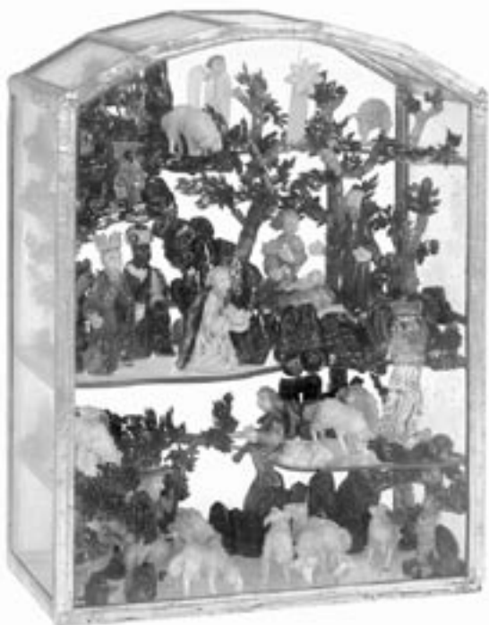
Skříňkový betlém s modelovanými skleněnými figurkami, Martin Hlubuček (profesor na SUPŠS Železný Brod), 1995, soukromý majetek

teriálu a vnějších formálních znaků, podle výrobce i konečného uživatele. Jako materiál sloužilo nejčastěji dřevo, ve škále je zastoupen také papír, vosk, sádra, tragant, cín, keramické materiály i nejrůznější masy, ať už na bázi papíru, či těstových a sádrových hmot. Ve 20. století se k této skladbě přidaly nové materiály, umělé hmoty a pryskyřice a konečně také sklo. Mezi skleněnými betlémy jsou nejznámější soubory z figurek modelovaných u kahanu, ale vyráběly se také těžší, tzv. hutní figurky, které byly masivní a měly větší pevnost. V rámci českých zemí se výroba figurek soustředila v Železném Brodě a okolí. Betlémové figurky vycházející z vinutí barevné skloviny jsou vlastně rarity a kromě Železnobrodská je jejich výroba zaznamenána jen ve sklárnách v Itálii a ve Francii. Skleněné artefakty s motivem Betlému však nelze omezit pouze na figurkové sestavy. Mnoho zajímavých věcí vzniklo také jinými sklářskými technikami – tavenou plastikou, litím do formy či technikou tiffany.