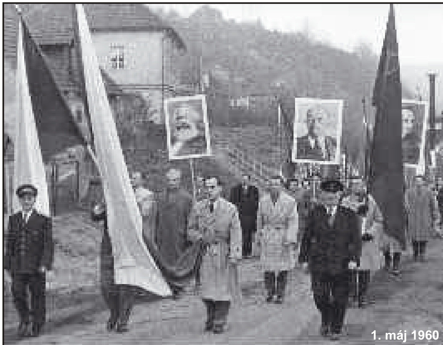
Mohutné čelo průvodu vychází jako vždy z Penicilinky