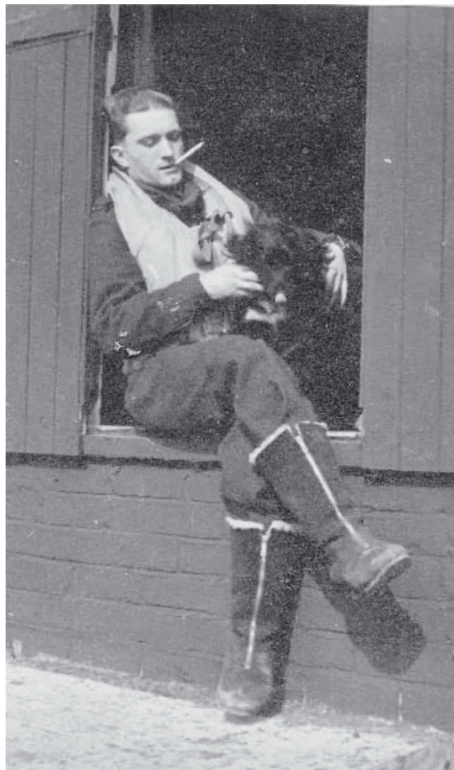
V Angli-čekání na poplach