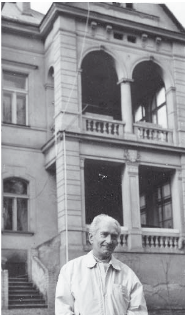
V r.1990 v Roztokách před svou bývalou vilou čp.125