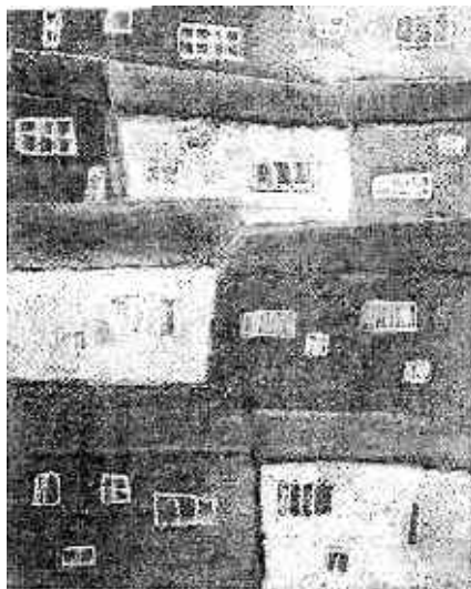
Vítězný obrázek Jiřího Kaftana „Město“

které kulturní aktivity v Roztokách dlouhodobě podporuje.