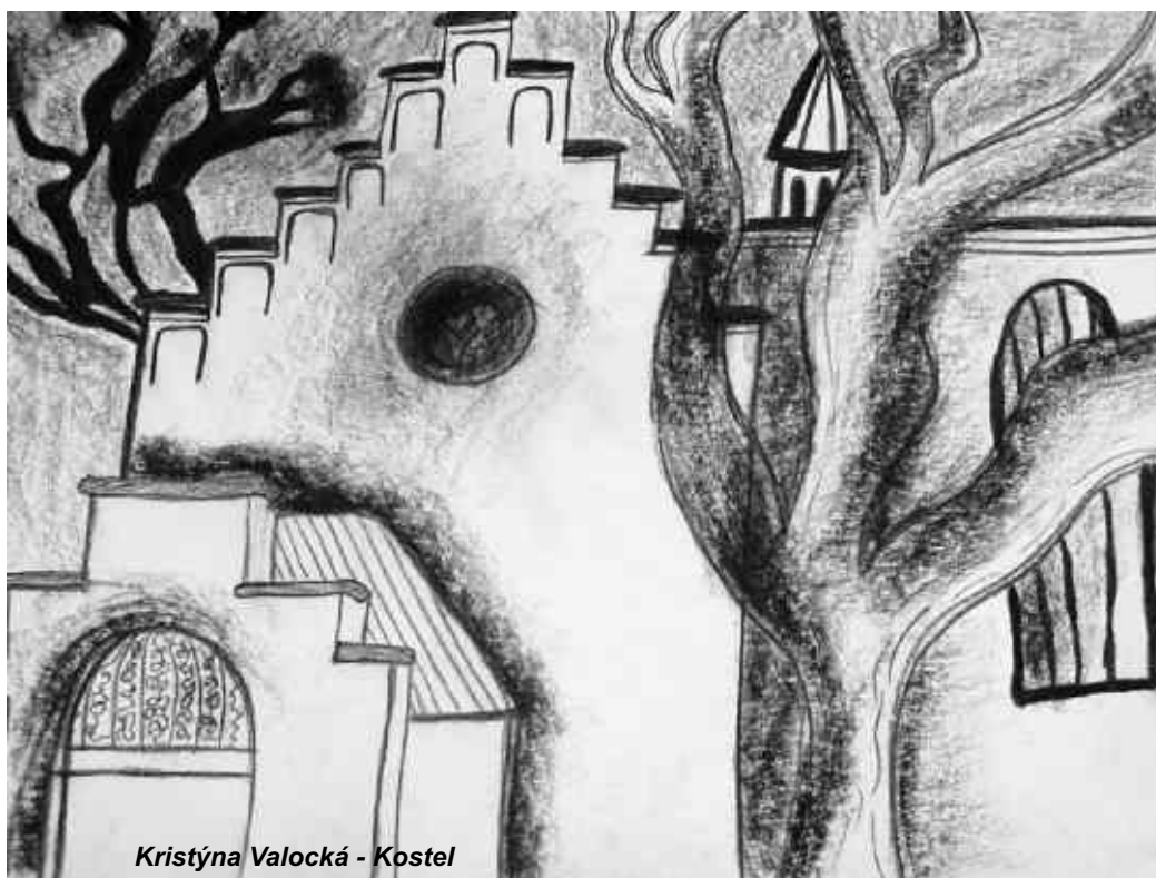
Kristýna Valocká - Kostel