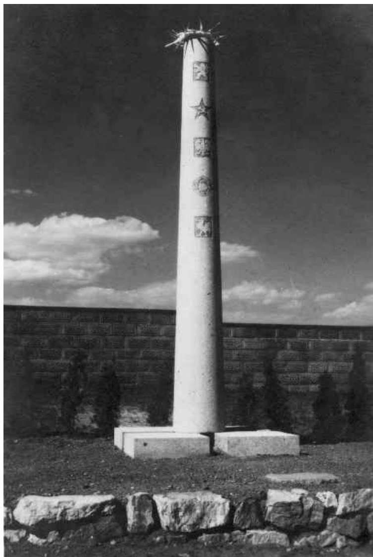
Památník obětem Transportu smrti na levohradeckém hřbitově - dílo sochařky Hedviky Zaorálkové

přes 80 vězňů. Do cíle v Dachau však transport nedorazil. Dne 8. května byl u Velešína v jižních Čechách zastaven partizány a vězni byli osvobozeni.