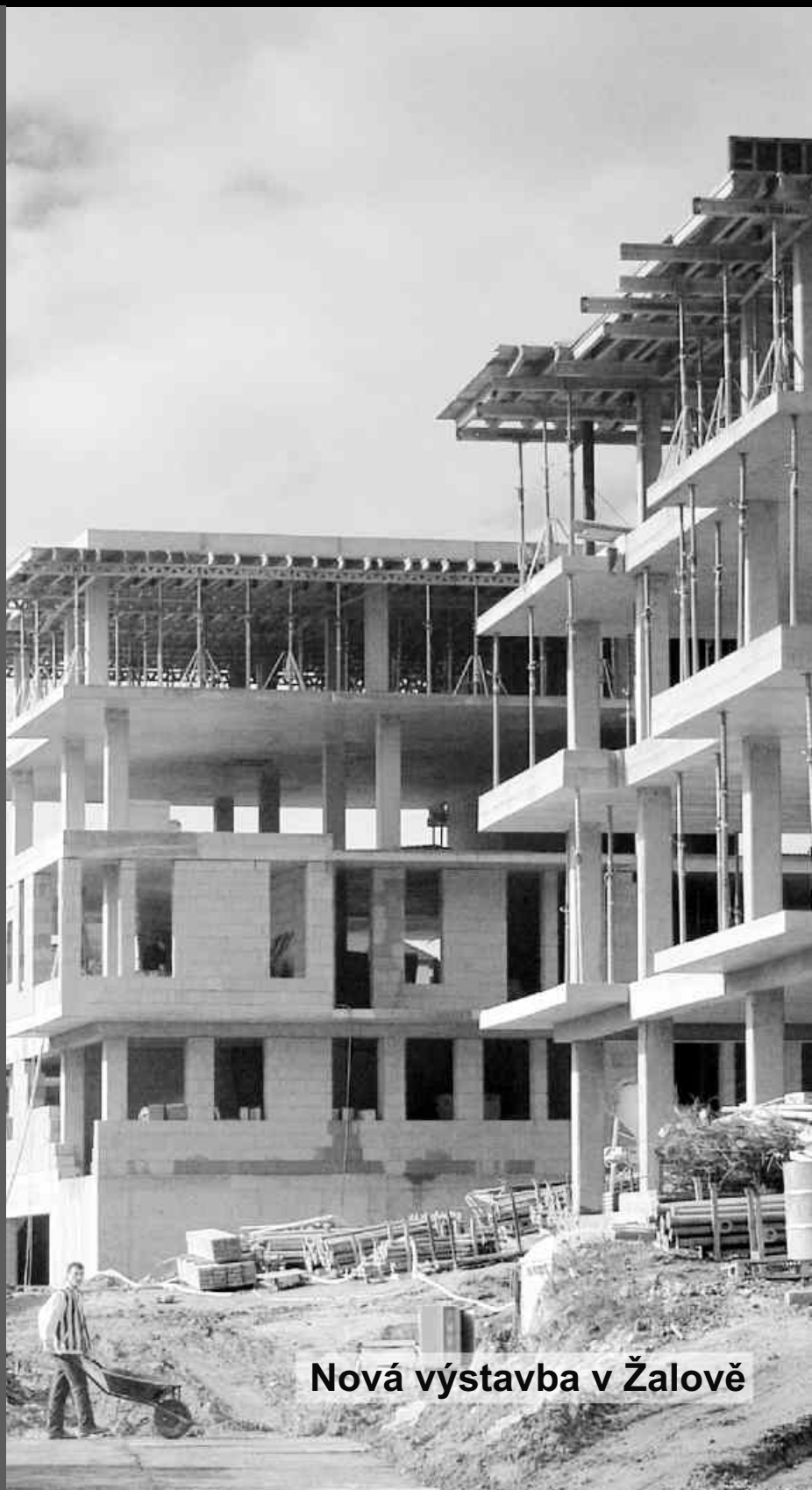
Nová výstavba v Žalově