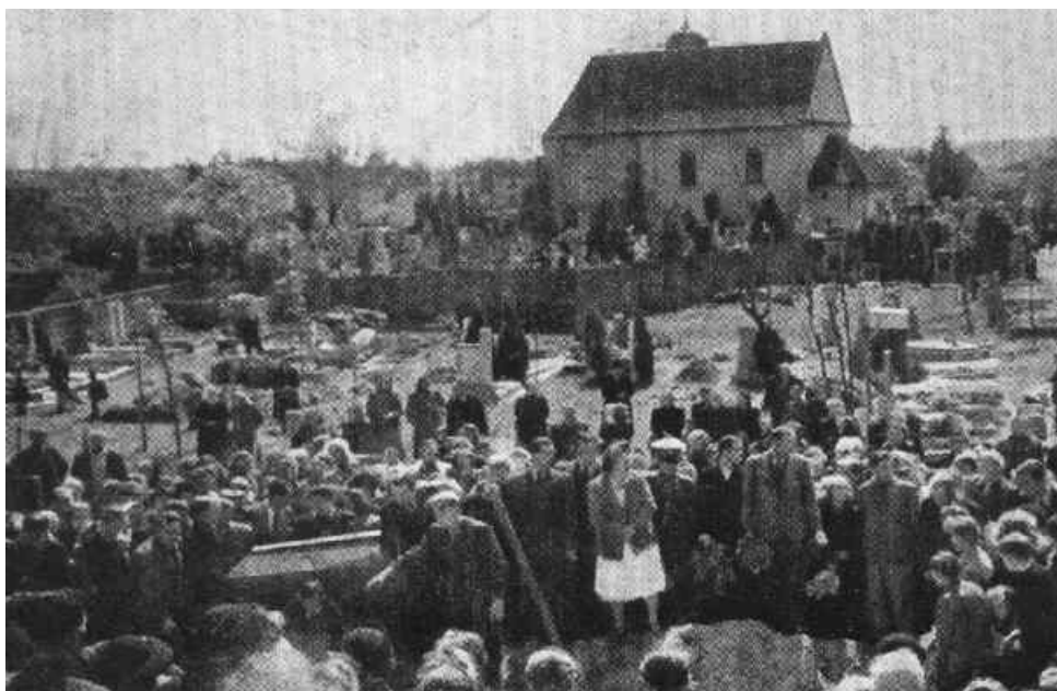
Pohřeb vězňů Transportu smrti dne 4.května 1945 na levohradeckém hřbitově

Pro dokreslení strastiplné cesty Transportu smrti a jeho konce je třeba ještě uvést toto: Transport odjel z roztockého nádraží 30 dubna okolo 16. hodiny. Pokračoval přes Prahu, kde na holešovickém nádraží byli zachráněni další vězni. Cestou na jih bylo k transportu připojeno dalších 19 vagonů s vězni z koncentračních táborů v Hradištku, Křepevicích a Vrchotových Janovicích. Při nesmyslném poježdění mezi Olbramovicemi a Křešicemi bylo zmasakrováno