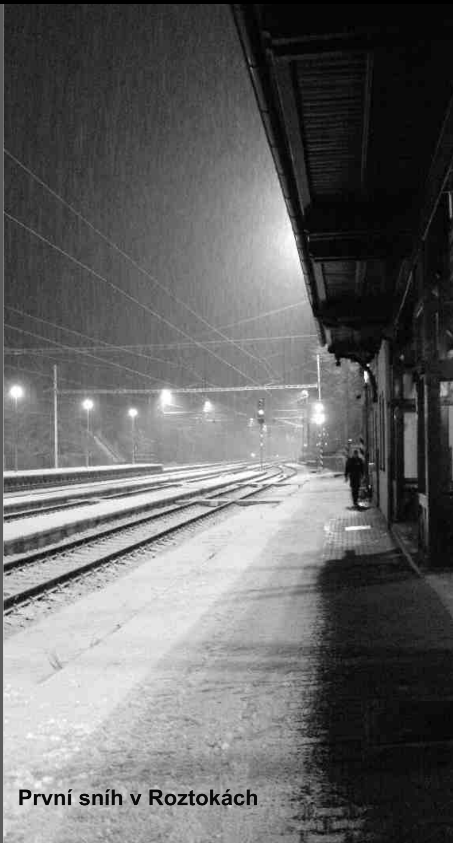
První sníh v Roztokách