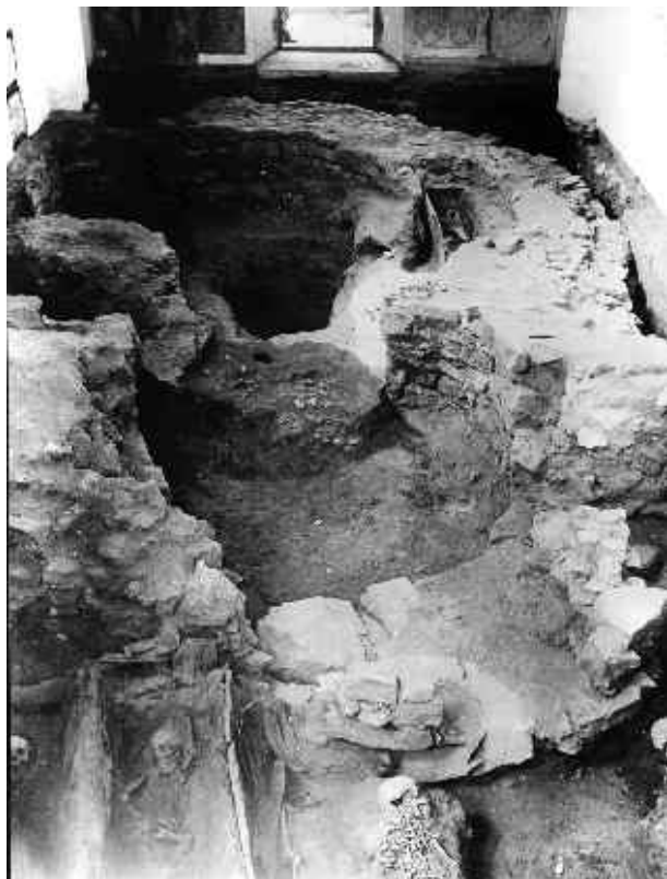
Základy rotundy odkryté pod podlahou kostela sv.Klimenta a kosterní nálezy při vykopávkách