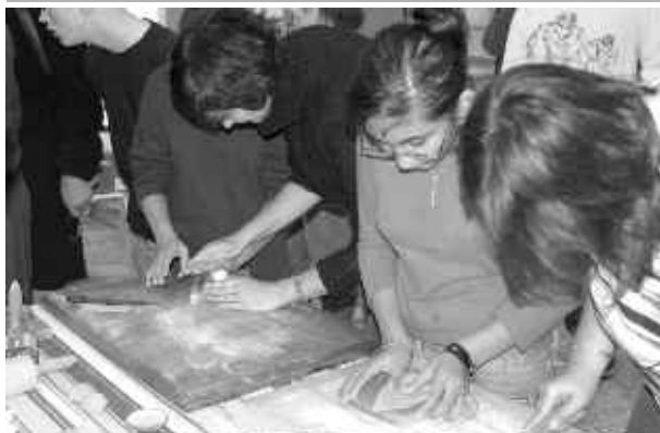
Děti ze Speciální školy J. Ježka pro nevidomé a slabozraké při návštěvě muzea.

Středočeské muzeum přeje všem čtenářům Odrazu krásné Vánoce a plno radosti a zdraví v novém roce.