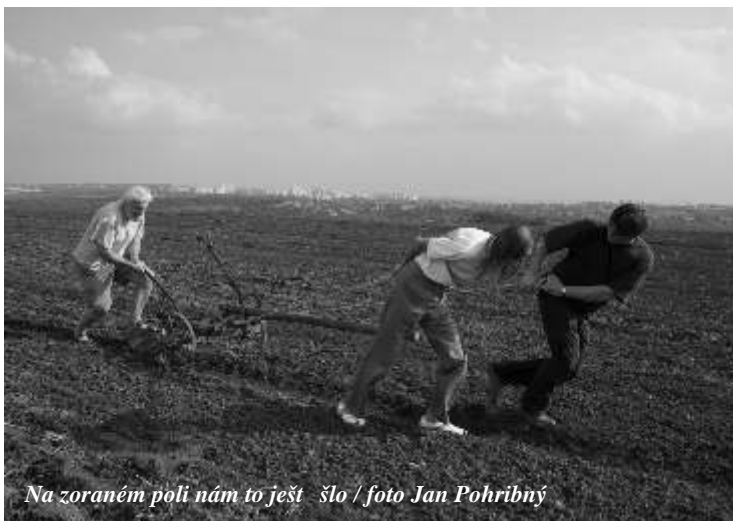
Na zoraném poli nám to ještě šlo