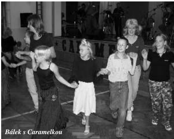
Bálek s Caramelkou

A country bálek s Caramelkou a kapelou Pěchmat? O tom, jak se nám líbilo dít i dospělým, vypovídá nejlépe fotografie. První podzimní den se v Roztokách zkrátka vyvedl.