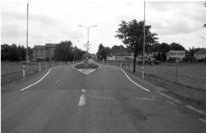
odstrašující - a vzorový p íklad, jak zklidnit dopravu