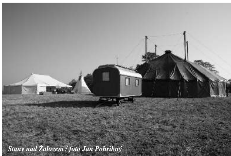
Stany nad Žalovem

Pátek 22. září, 19 hodin 40 minut. Chvilé, jejíž význam snese srovnání s okamžikem, kdy byl slavnostně poklepan základní kámen pro stavbu Národního divadla.