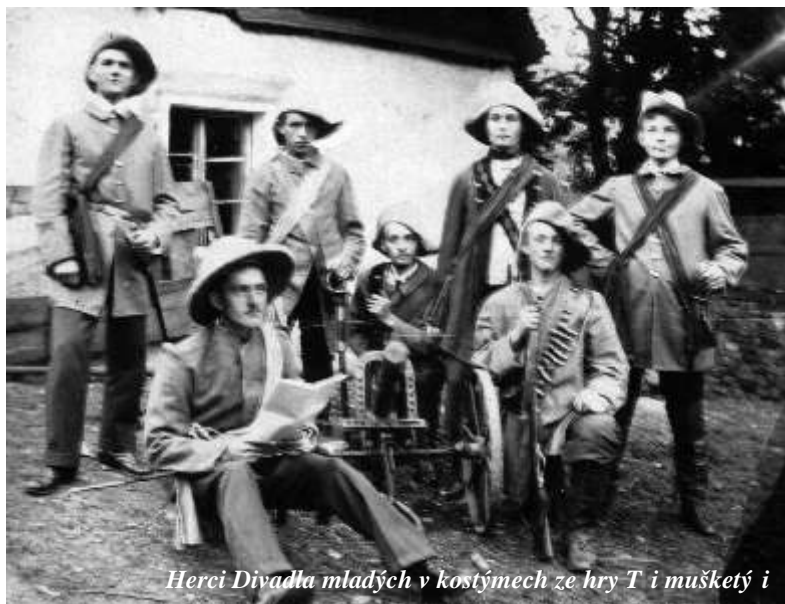
Herci Divadla mladých v kostýmech ze hry Tři mušketéři

Po r. 1918 nedošlo v Roztokách ani v Žalově k rozsáhlejší výstavbě výrobních závodů a provozů. Pokračovala koželužna a cihelna v Žalově, Felklova „koulovna“ v Roztokách, provoz firmy Wohanka v Nádražní ulici. Nově vznikla Lochmanova sodovkárna a svítkárna v p. 27 (dnes bytový komplex „Na Ostrohu“). Roztocký velkostatek a zámek přešel do vlastnictví pana Mareše (3/4) a Práška (1/4). V objektu Hellerovy lisovny oleje (dnešní VÚAB Pharma) sídlila krátce výrobní zemědělská družstva, pak výrobní družstvo kovářů a dělníků, od r. 1924 zde bylo zřízeno sanatorium MUDr. Šípka. Intenzivní stavební činnost vedla ke vzniku řady dnes již zrušených pískoven (připomeňme na Holém Vrchu, na žalovských skalkách, v místě dnešní autoopravny, v Tichém údolí), malých soukromých komorových cihelen a také řady stavebních firem (firmy Dídlova, Ilichova, Ajmova, Landova, Novákova, Kmochova-ta šla v r. 1935 do konkurzu). Zastaven byl provoz cihelny v Tichém údolí, nebyl povolen provoz pražírny kávy ve Spáleném mlýně. V obou obcích přetrvávala po dlouhou dobu řada řemeslných provozoven a živností, takže podíl občanů dojíždějících za prací mimo bydliště nepřesáhl 60 % obyvatel. Oblíbené a rozšířené bylo pronajímání letních bytů, letní pobyty v roztockých hotelích v Tichém údolí.