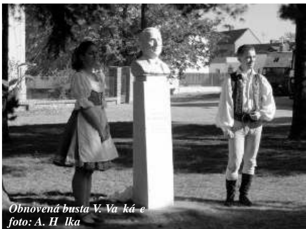
Obnovená busta V. Václavka

Na umělecké trhy navázalo velmi zdařilé a bohaté, skoro tisícem lidí navštívené připomenutí 125. výročí narození Václava Václavka, který v Roztokách pobýval a složil zde svůj nejvtíší sláger Sen lásky. Hostující Martin Maxa hrál namísto nasmlouvaných dvaceti minut téměř hodiny a Pražský salónní orchestr bavil publikum všech generací málem do setmění. Díky patří Vladimíru Víchovi za organizaci a samozřejmě také Zlatě Dobošové za perfektní (a levné) zrestaurování busty skladatele.