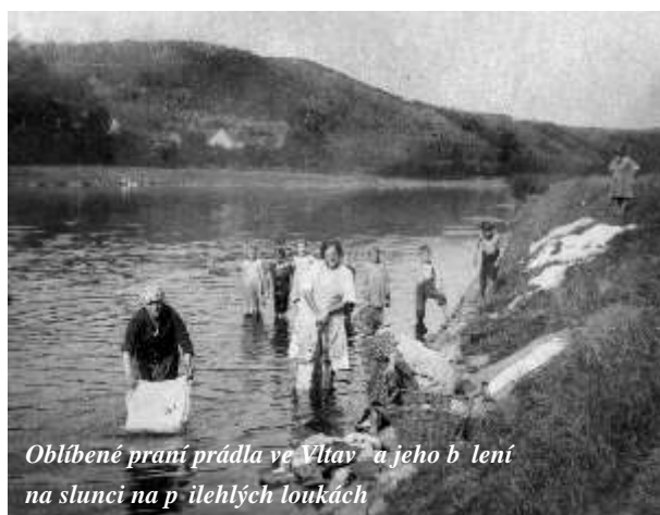
Oblíbené praní prádla ve Vltavě a jeho bělení na slunci na přilehlých loukách

Pro zlepšení dopravních podmínek severozápadně Prahy vznikaly již tehdy směle projekty (k jejich oživení dochází až v dnešní době). Tak 28.3.1928 probíhala za dohledu zemské politické správy a okresu jednání o projektu mostu Roztoky-Klecany (autor projektu Dr. Ing. Prošek navrhl oblouk o rozpětí 144 m se zavěšenou vozovkou 25 m nad hladinou, vozovka 6m, oboustranné chodníky á 1,2m). V r. 1931 byl posuzován záměr výstavby „Povltavské silnice“ z Prahy do Kralup a dále na sever.