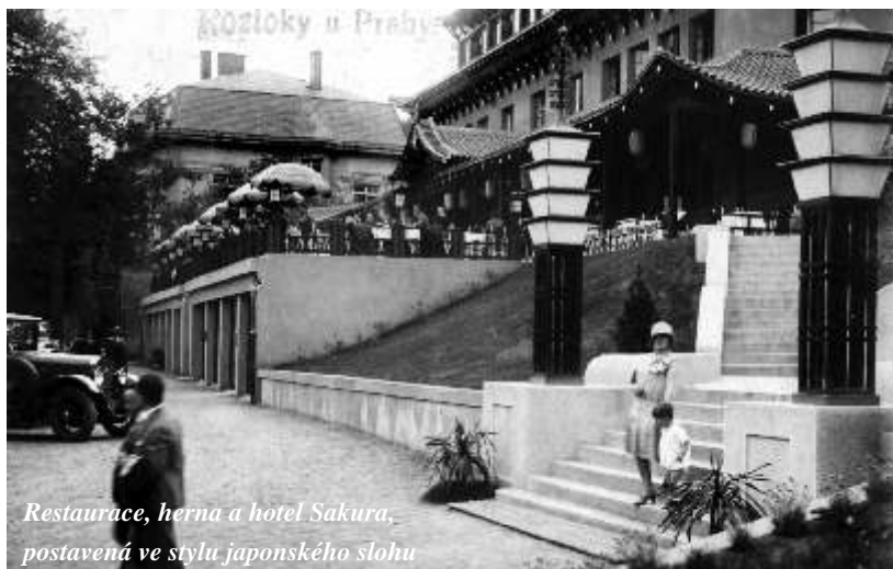
Restaurace, herná a hotel Sakura, postavená ve stylu japonského slohu