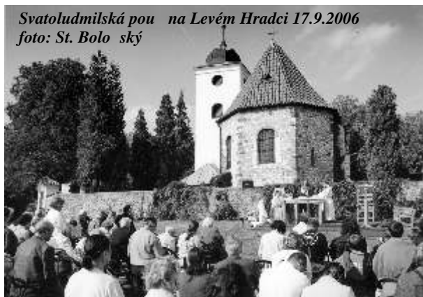
Svatoludmilská pouť na Levém Hradci 17.9.2006

Především se objevily úvahy o tom, že se s Klecanskými spojíme mostem. Asi bych si to odpustil, aspoň do doby, než si zvyknou nejen na rámus ze svého lomu, ale taky na Rozkíky.