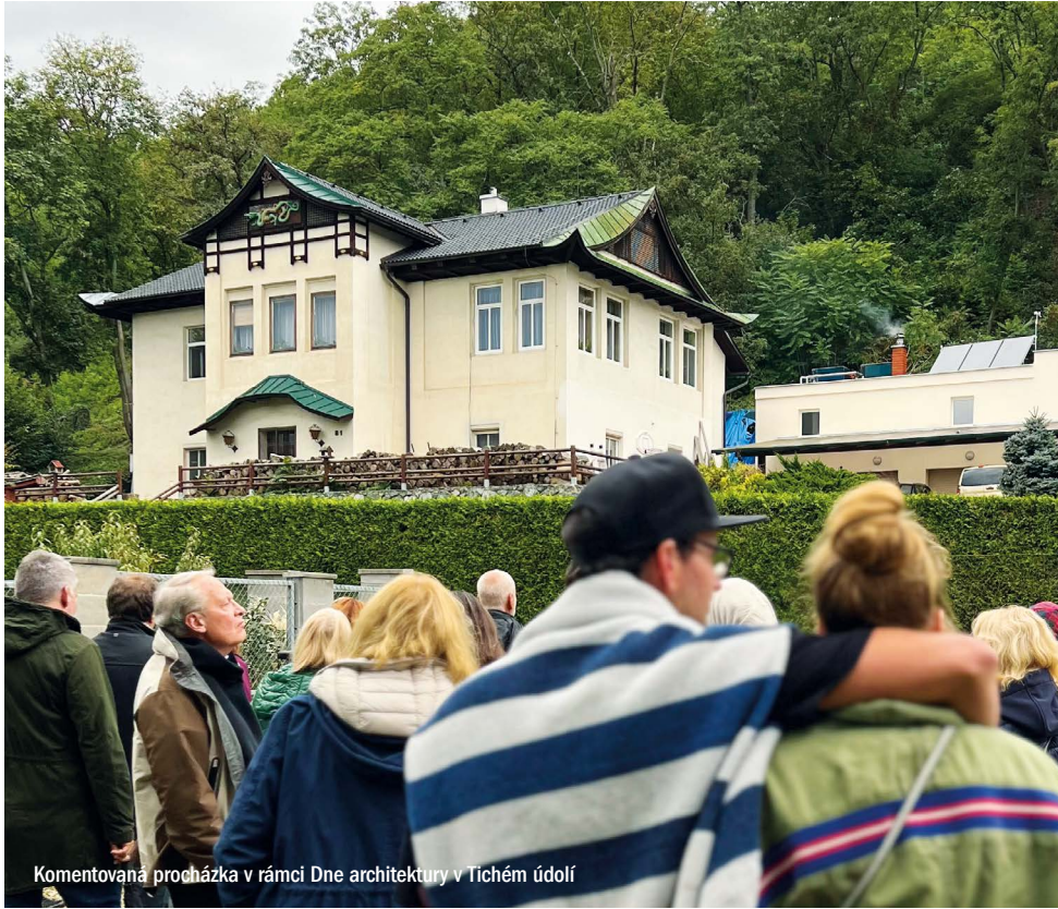
Komentovaná procházka v rámci Dne architektury v Tichém údolí

V sobotu 28. října jsme se připojili k celorepublikovému festivalu Den architektury, který již po čtrnácté pořádal Spolek Kruh. Mottem letošního ročníku byl „Proces proměny“, který odkazuje ke dvěma slavným dílům spisovatele Franze Kafky, jehož sté výročí úmrtí si letos připomínáme.