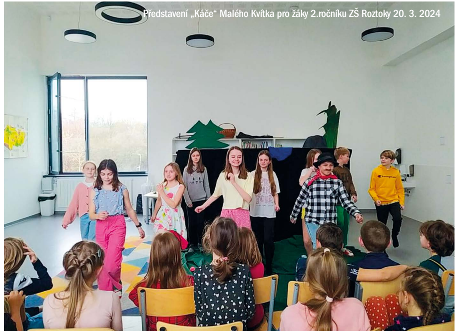
Představení „Káče“ Malého Kvítka pro žáky 2.ročníku ZŠ Roztoky 20. 3. 2024

V letošním roce nám byla poskytnuta dotace na „Podporu činnosti organizace“ od Středočeského kraje a na akci „Putujeme za pohádkou“ městem Roz-