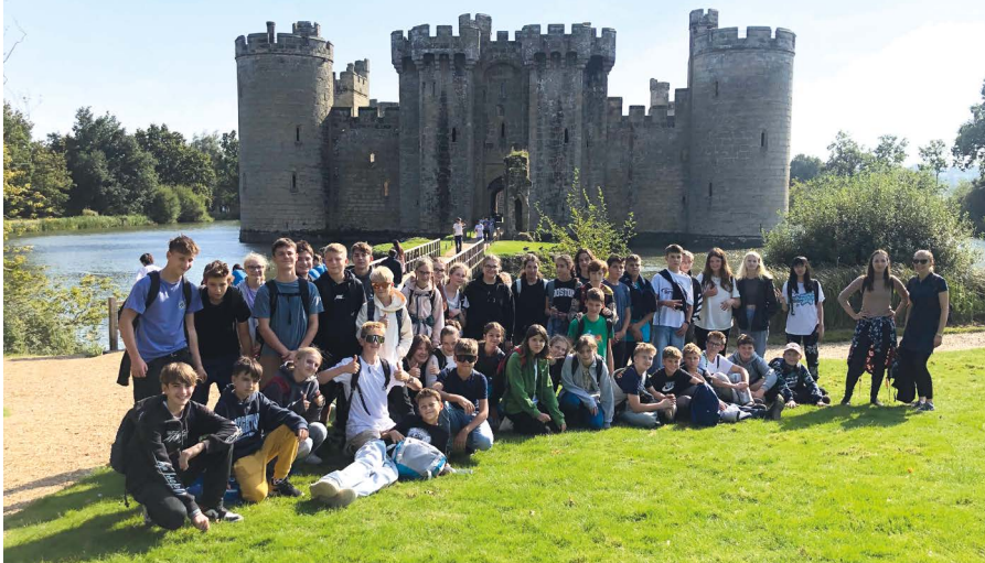
Žáci před Bodiam Castle

D ěti bydlely po dvou až třech v hostitelských rodinách, aby nahlédly do anglického života se vším všudy. Rodiny se o ně staraly, vařily jim, vozily děti k autobusu a povídaly si s nimi o všem možném. Denní program byl nabitý každý den a počá-