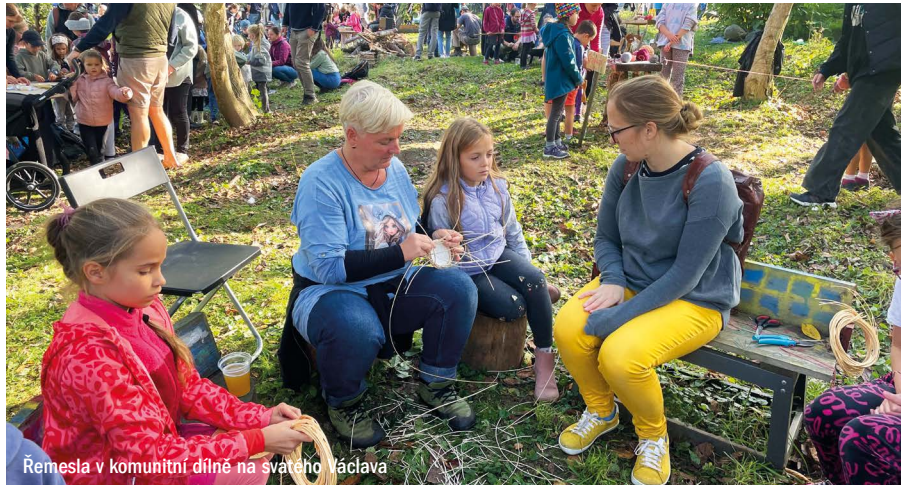
Řemesla v komunitní dílně na svatého Václava

Na počest prvního ročníku „Řemesel v Rostokách“ jsme na pozemku zasa-