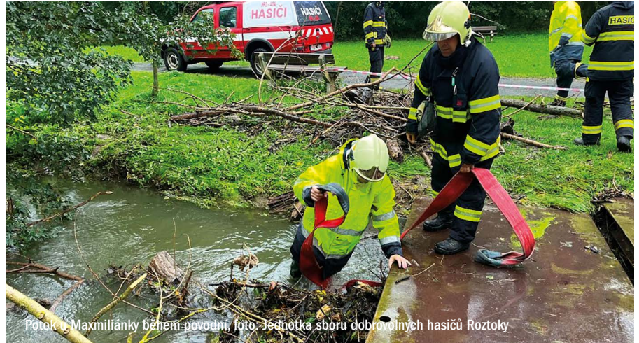
Potok u Maxmiliánky během povodní