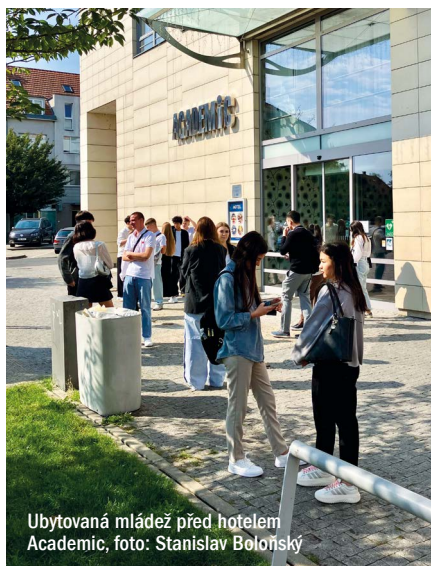
Ubytovaná mládež před hotelem Academic

V bloku věnovaném rozpočtovým otázkám vzali zastupitelé na vědomí stav čerpání městského rozpočtu ke konci srpna a schválili řadu rozpočtových opatření. Trochu paradoxní je, že i když jsme na území Roztok hazard zakázali, plynou nám z něj slušné peníze, a to natolik, že jsme