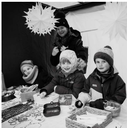
Vánoční trhy dětských prací

V prosinci také naši pedagogové spolu s lektory Roztoče absolvovali akreditovaný kurz Základy podpory zdravého klimatu třídy. Pozornost byla věnována systému základních potřeb žáka a vlivu jejich nenaplně-