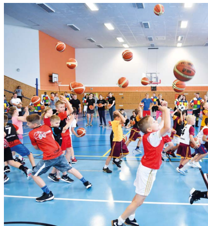
Naděšené děti zapojené do tréninku basketbalu

hybově nepříliš nadané děti, kterým vtipně říkáte „mouličí“. Kolik máte případů, kdy jste třeba nesportující děti natrvalo přivedli k sportu?