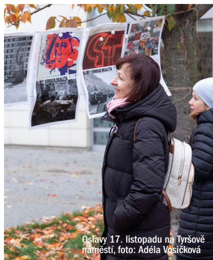
Oslavy 17. listopadu na Tyršově náměstí