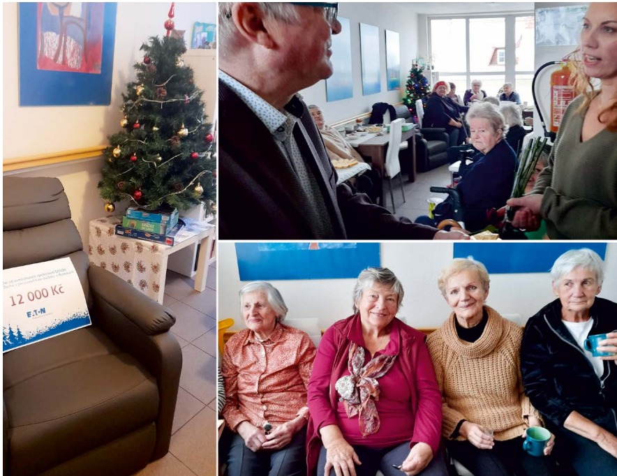
Vánoční večírek v DPS, během kterého proběhlo předání věcných darů seniorům

T outo cestou bychom rádi poděkovali zaměstnancům společnosti Eaton v Roztokách, kteří vytvořili finanční sbírku pro naše obyvatele domu s pečovatelskou službou ve výši 12000 Kč. Za tyto finanční prostředky byly nakoupeny rehabilitační pomůcky ve formě masážního křesla, her na procvičování paměti a každému seniorovi byl předán masážní míček. Předání věcných darů proběhlo při příležitosti vánočního večírku v prostorách DPS, kde panovala velmi příjemná atmosféra.