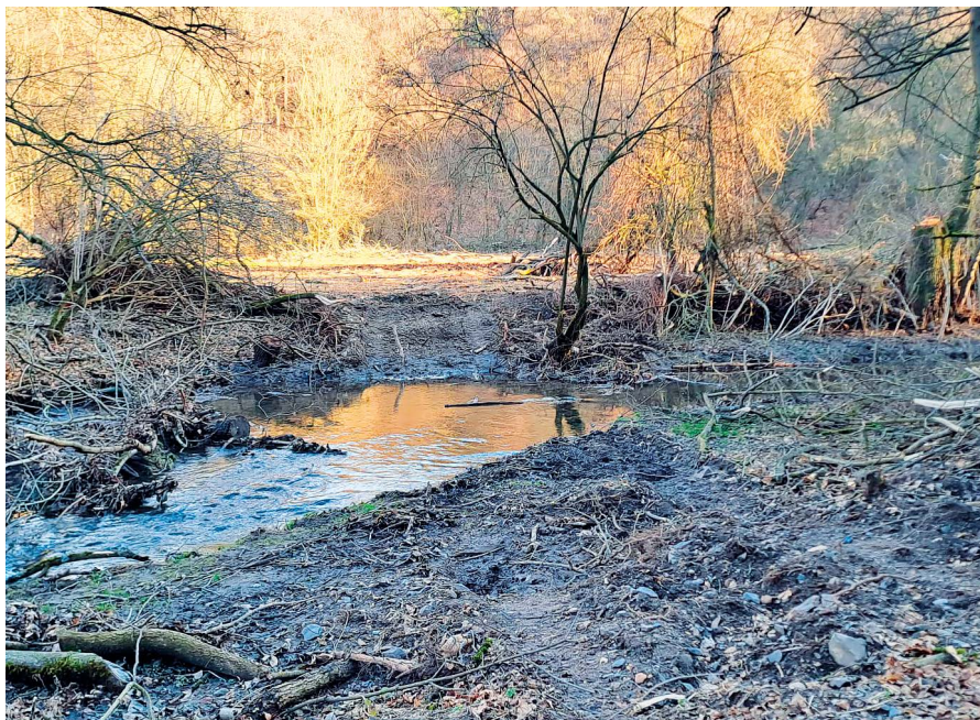
Stav jednoho z míst po kácení v Tichém údolí

Krajský úřad pro kácení předepsal podmínky jen velmi obecné s tím, že po skončení těžby má být plocha uvedena do původního stavu (myšleno případné zásahy do terénu). Náhradní výsadba není nařízena, což je ale v pořádku – místo tohoto typu se samo brzy zazelená novými stromy. Je fér dodat, že město Roztoky bylo účastníkem správního řízení a informaci o plánovaném kácení ze Středočeského kraje dostalo. Ve správnou chvíli ale nezafungovala vnitřní komunikace a úřad nevyužil všechny možnosti, které má (město mělo možnost navrhnout nějakou formu omezení rozsahu kácení, podmínek využití cest a vyvážení dřeva a podobně). Je to pro nás poučení a přenastavili jsme u podobných typů informací vnitřní procesy tak, aby nám příště podobná věc nepropadla a mohli jsme využít všechny možnosti, které nám zákon dává, k tomu lesnické práce v Tichém údolí ovlivnit a kontrolovat.