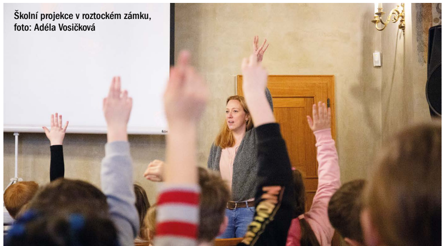
Školní projekce v roztockém zámku

televizi v pořadu Planeta Yó. Jak se jim vedlo uvidíte v průběhu března. Klárka (4. ročník) byla se svou třídou dvakrát na dopoledních školních projekcích a Terežka (1. ročník) navštívila projekce určené rodičům a jejich dětem. Nyní vám přinášíme alespoň krátký rozhovor.