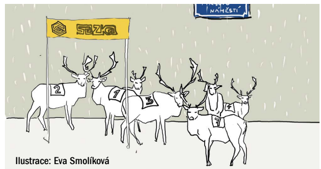
Ilustrace: Eva Smolíková

MP děkuje nálezčům, kteří v tomto období vložili do schránky důvěry hodinky, průkazy, karty a další nálezy, které se tak vrátili k majitelům.