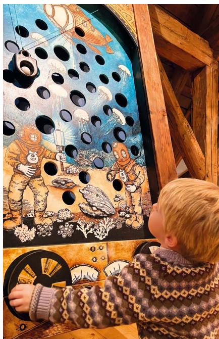
Velká kočovná herna Sládkovna na zámecké půdě potěší malé i velké