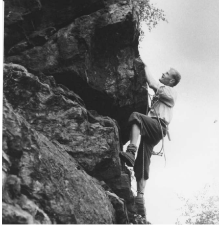
Holý vrch 10. 7. 1966, Alšova vyhlídka – Pilíř