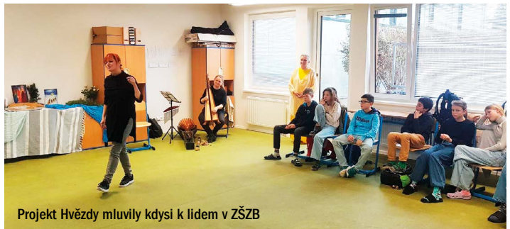
Projekt Hvězdy mluvily kdysi k lidem v ZŠZB