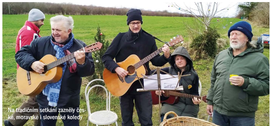
Na tradičním setkání zazněly české, moravské i slovenské koledy