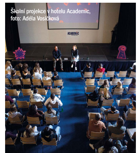
Školní projekce v hotelu Academic