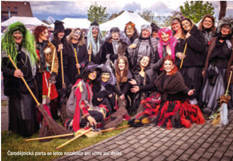
Čarodějnická parta se letos nezalekla ani větru ani deště

Letošní čarodějnice byly pro realizační tým velkou zkouškou, kterou jsme, myslíme, se ctí překonali.