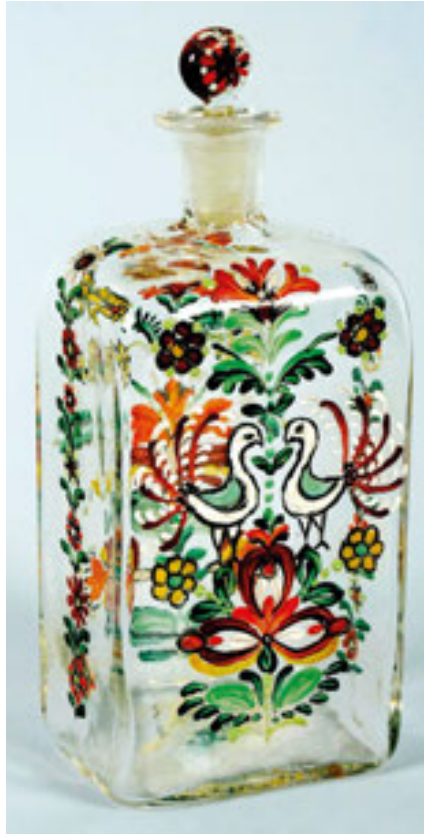
Sklo Zdenky Braunerové

„Byla jsem v okolí Telče, v malé vesničce jménem Dubenky, a jela jsem tam hlavně kvůli sklárnám, které tam v blízkosti jsou. Dělal jsem seriózní pokusy ve skle a dala si vyfouknout různé formy dle svých nákresů. Ale jak mne to tam bavilo. Bydlila jsem u nadpomyslených hodných lidí – u učitelů, kde stará paní, mladá paní a sestra učitelova, tři to živořící ‚mušle‘, mi činily, co mi na očích viděly... Strávila jsem skorem všechen čas v hutích, kde jsem si oblíbila obzvláště jednoho dělníka, který pochopil, co chci. Jednalo se mi o volně foukané sklo, vše ruční práce totiž, ne lité a ne broušené, a tak myslím, že vyhotovili jsme některé velmi pěkné formy. Zůstala jsem věrná tradici starého českého skla, ale přirozeně jsem sem tam pozměnila tvary, až i docela nové jsem vymyslela. V Dubenkách bydlí malíř skla, kterého znám již z Telče, a tam jsem si hned sklo namalovala. Zdokonalila jsem se ve znalosti techniky, a mohu směle to říci, že se mi některé servisy moc líbí. Přivezla jsem si 16 různých servisů na pivo, víno, whisky, likér atd., vše omalované, vždy různě, a ráda bych s tím vyrukovala někam do veřejnosti. Něco pošlu do Ber-