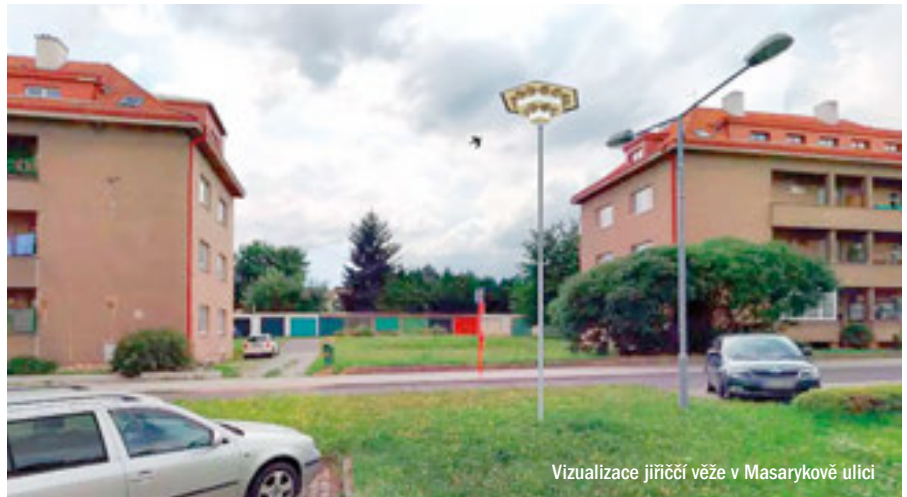
Vizualizace jiříččí věže v Masarykově ulici

Jednu takovou jiříččí věž bychom rádi ve spolupráci s Českou ornitologickou společností postavili uprostřed zeleného pruhu mezi oba pruhy Masaryko-