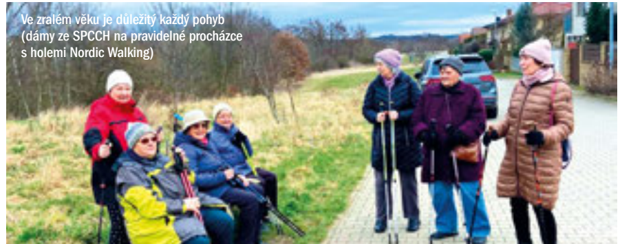
Ve zralém věku je důležitý každý pohyb (dámy ze SPCCH na pravidelné procházce s holemi Nordic Walking)

Je důležité, abychom se i v seniorském věku účastnili společenských aktivit a akcí, scházeli se s přáteli a mohli si s nimi povídat. Právě odborníci doporučují účast ve spolcích, abychom nebyli osamělí a tzv. „neblbli“ z opuštěnosti a samoty. Samozřejmě, že tzv. „blbnutí“ si moc nevybírám a de-