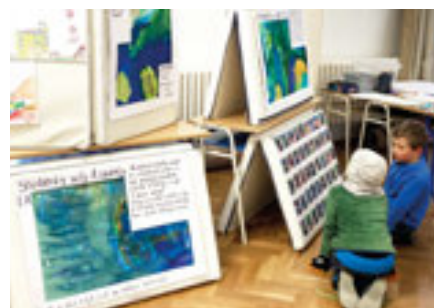
Výstava děl s ekologickými motivy ku příležitosti Dne Země

I tento rok jsme s radostí a krásně pěšky došli na promítání filmů festivalu Jeden svět. Naše škola viděla sestavu tří filmů určenou pro mladší prvostupňové školáky. Oceňujeme výběr snímků i následnou dobře vedenou diskuzi. Děti si o projekci ještě dlouho povídaly a my si moc vážíme do velkoměsta, ale festival jezdí za námi.