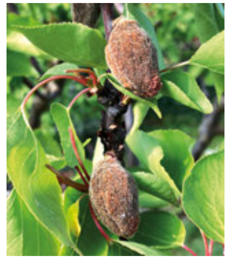
Pomrzlé ořešáky v ul. Jana Palacha a zmrzlé plody meruněk

Rozsah poškození vegetace je velmi ši- roký a neobvyklý, osobně si na něco po- dobného v posledních padesáti letech opravdu nevzpomínám. Na straně druhé je třeba vzít v úvahu, že podobné výkyvy počasí trápily i naše předky. Připomenu jen „zimu 20. století“ 1928/29, kdy byla v Čechách naměřena i historicky nejniž- ší teplota -42,2^{\circ}\text{C} . I v Roztokách dosaho- valy únorové mrazy kolem -30^{\circ}\text{C} . Podob- ně jako letos mrzlo i v dubnu. Tehdy byla postižena v sadech nejen násada ovo- ce, ale i vlastní stromy – vymrzly praktic- ky veškeré slavné roztocké třešně i další