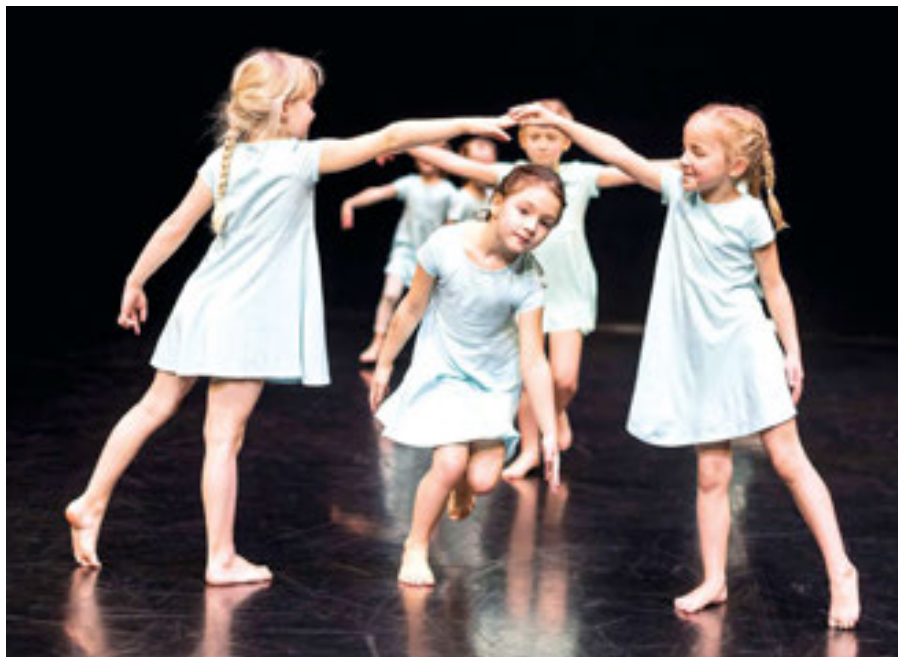
Taneční vystoupení Píp!

Tančíme od dubna skrz květen až do června. Tak si pojd'te zatančit s námi.