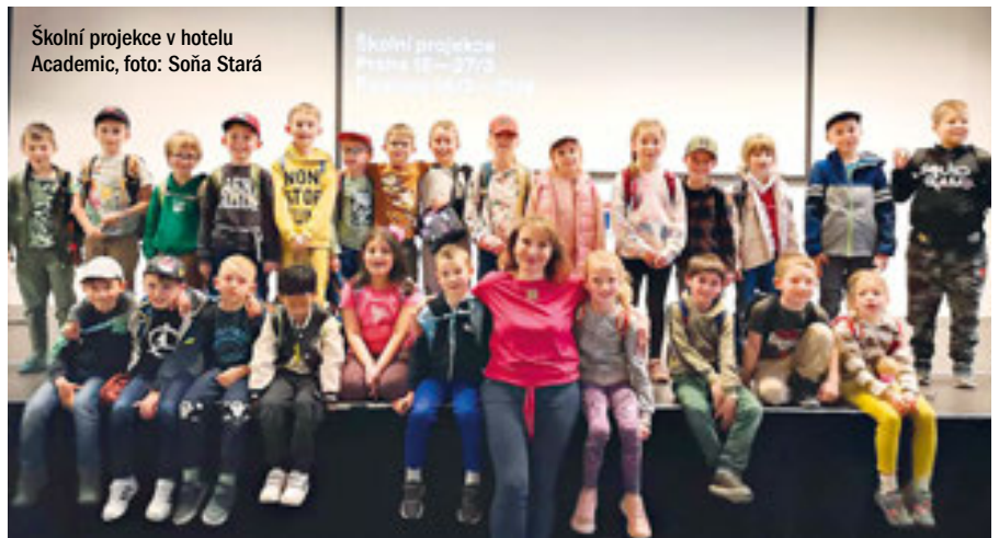
Školní projekce v hotelu Academic

vuji. Děkujeme také našim dobrovolníkům a dobrovolnicím nejen z řad Roztoče a roztockých Tomíků, bez kterých by to zkrátka nešlo!