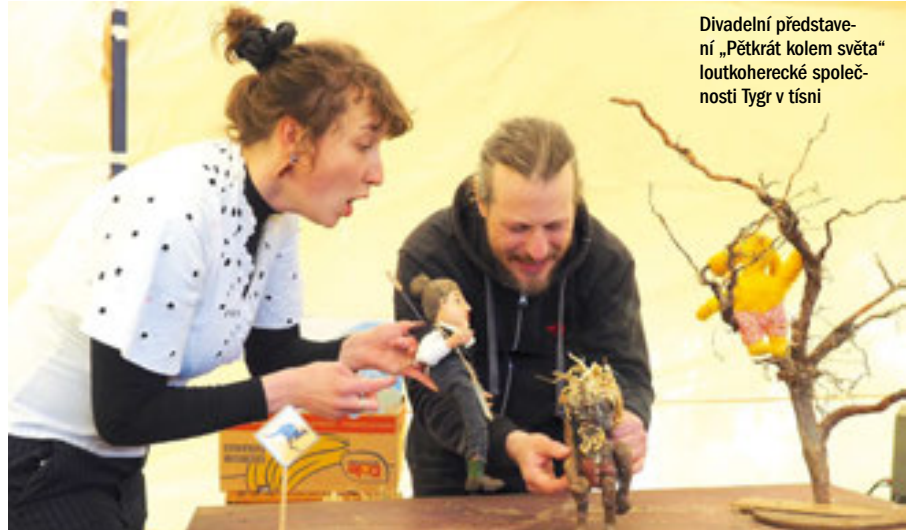
Divadelní představení „Pětkrát kolem světa“ loutkoherecké společnosti Tygr v tísní