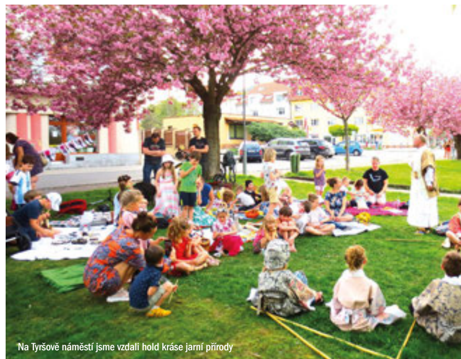
Na Tyršově náměstí jsme vzdali hold krásě jarní přírody