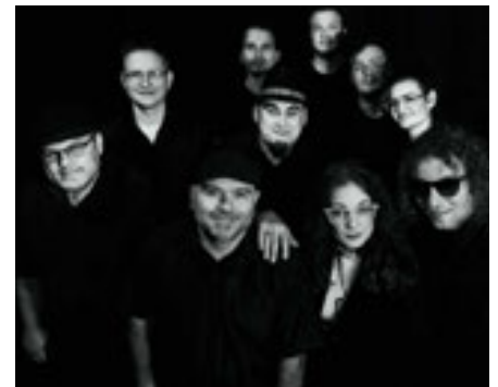
Hudební skupina Sto zvířat