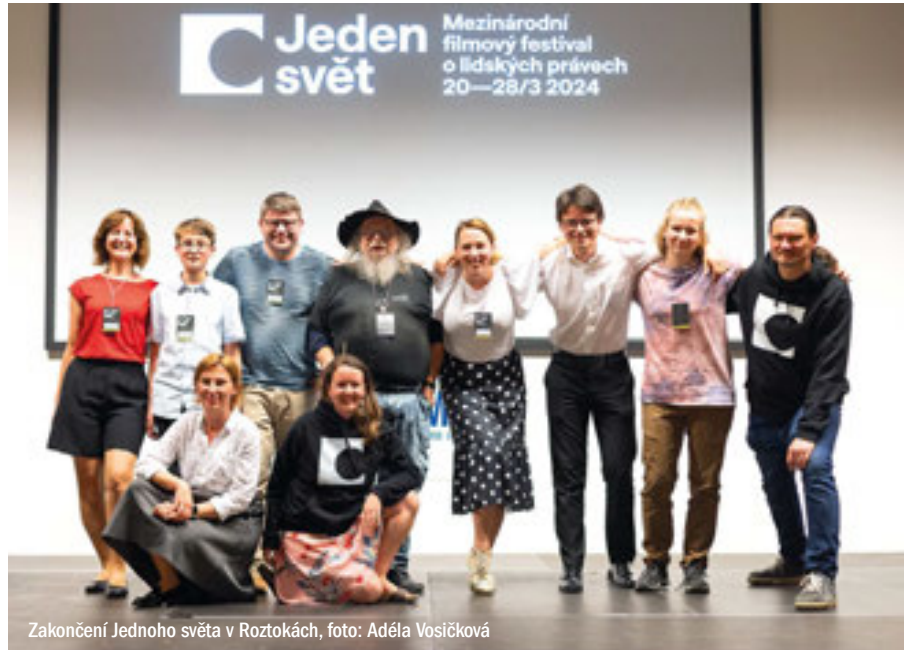
Zakončení Jednoho světa v Roztokách

Festival by se samozřejmě neobešel bez finanční a organizační podpory našich partnerů a spoluorganizátorů. Děkujeme tímto: město Roztoky, Eaton, Únětický pivovar, Café Vratislavka, Husův sbor, hotel Academic, roztocký Mikuláš, anděl a čert. Dále děkujeme všem skvělým lidem, kteří nám pomáhají a festival podporují a navště-