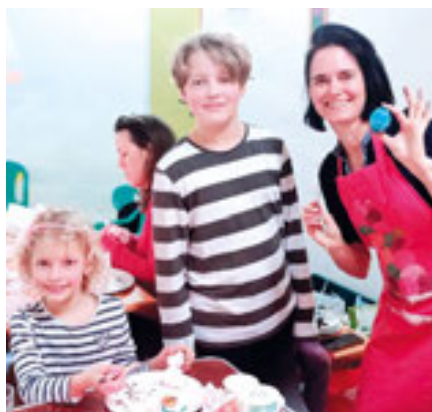
Tvoření pysanek, foto: Eva Juskaninová Meningerová

Bylo to příjemně strávené dopoledne, ze kterého jsme si odnášeli pysanky – kraslice, kterými jsme si vyzdobili velikonoční stůl a nafotili je na přáníč-