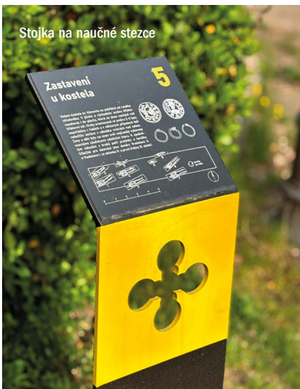
Stojka na naučné stezce

ního roku bylo nově vyřešeno umístění popelnic na novém hřbitově. Design současnému řešení dal opět roztocký architekt Ondřej Smolík. V budově pohřební kaple vznikne další městské kolumbárium. Návrh prošel městskou radou a souhlasila s ním i památková péče, zbývá tedy jen vysoutěžít a začít budovat.