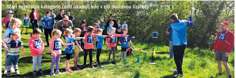
Start nejmladší kategorie (dětí ukazují, kde v cíli dostanou lízátko)