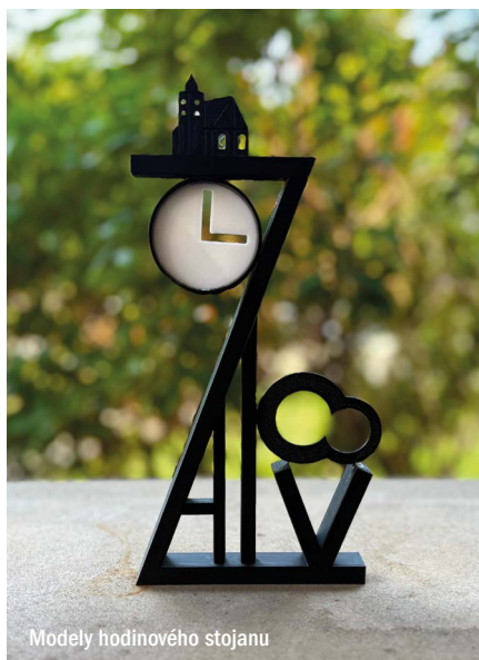
Modely hodinového stojanu

Na finančních prostředcích za specifický hodinový stojan se budou podílet roztočtí a žalovští obyvatelé a návštěvníci, kterým se náměstíčko a pojetí jeho rekultivace líbí. Sa-