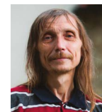
JARDA HUK PŘEMYSLOVSKÉ STŘEDNÍ ČECHY O.P.S.

logie pro MAS – výzva II. Ze zkušeností z předchozích výzev víme, že je vhodné záměr předem probrat se specialisty z Agentury pro podnikání a inovace (API), kteří posoudí, zda je návrh dostatečně „chytrý“ a má šanci uspět. ■