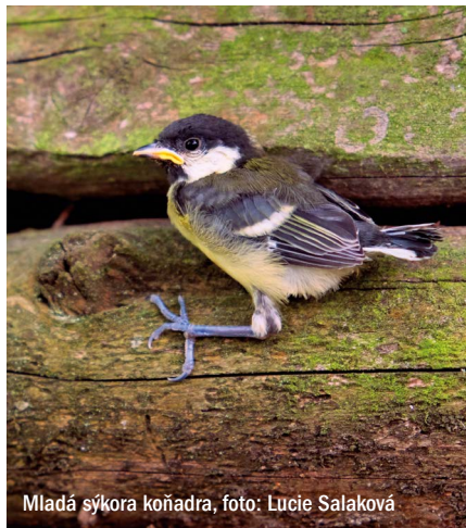
Mladá sýkora koňadra

V tomto období také prosím: nenechávejte psy a kočky volně pobíhat. Lovcový pud je silný a ptáčata jsou snadnou kořistí. Ale váš pes nebo kočka přece lovit nepotřebují. I obyčejné vodítko na procházce může zachránit životy.