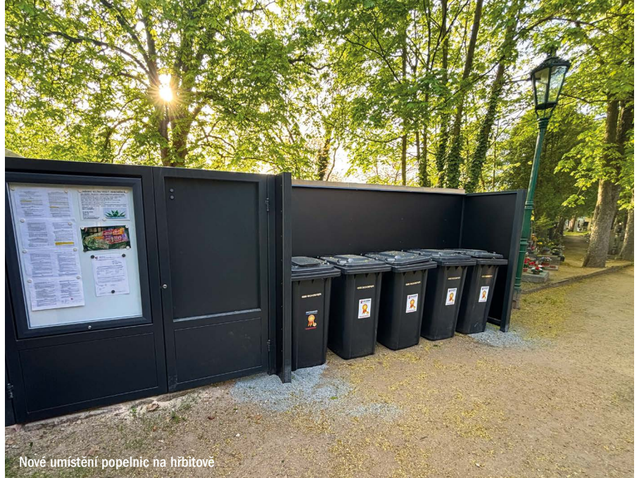
Nové umístění popelnic na hřbitově

Rád napíšu, že v setrvalé péči o Levý Hradec pokračujeme. V dubnu letoš-