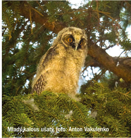
Mladý kalous ušatý

Záchranné stanice jsou každé jaro plné zbytečně „zachráněných“ mláďat – a pak mohou chybět kapacity pro skutečně zraněná zvířata. Co tedy dělat? Nejlépe nic. Pokud je ptáče v nebezpečí (např. na silnici nebo mezi psy), opatrně ho přeneste do keře či na strom poblíž. Rodiče si ho najdou. Nemusíte se bát na ptáče sáhnout – ptáci mají slabý čich. Naopak mláďat savců (například malých zajíčků nebo srnčat) se nikdy nedotýkejte! Pouze, pokud je ptáče zraněné nebo na opravdu nevhodném místě, kontaktujte záchrannou stanici ( www.zvirevnouzi.cz ). Roztoky spadají pod ZS Kladno – Čabárna.